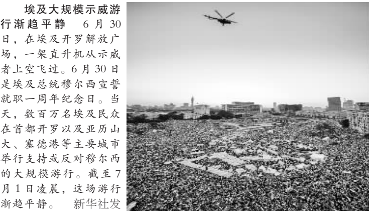
埃及大规模示威游行渐趋平静

在异常高温干燥的天气下,7月4日独立日(美国国庆)即将来临,为此而出售的烟火也带来又一重隐忧。航空公司密切关注气温变化,以决定是否推迟部分航班。全美航空公司因高温取消了18次航班。 美国国家气象局30日发布的数据显示,连日来美国西部已有多地创下高温新纪录。目前,加利福尼亚州、亚利桑那州和內华达州等地已发布极端高温警报。