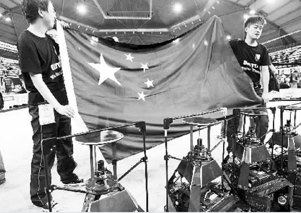
6月30日,在荷兰埃因霍温,中国北京信息科技大学的师生们庆祝在机器人世界杯足球赛中型组比赛中夺冠。

后的加时赛中,北京信息科技大学的机器人球员没有给对手机会,以一记漂亮的射门“金球”取胜。 机器人世界杯始于1997年,如今已成为各国展示人工智能最新进展和进行人工智能技术交流的重要平台。本届比赛共有美国、德国、巴西、西班牙、意大利、中国等约40个国家和地区的2500名“选手”参赛,在机器人足球、机器人搜救、机器人家居服务、机器人技能展示等多个领域一决高下。 在其中的机器人足球比赛中,共有二维模拟、三维模拟、小型组、中型组等多个项目。在此番中国学子夺冠的中型组比赛中,每场比赛双方各有5名身高约80厘米的机器人球员,在一块18米×12米的室内场地进行比赛。这些机器人球员均配有传感器和内置电脑,可借助无线通信系统与队友“交流”或接受裁判指令。