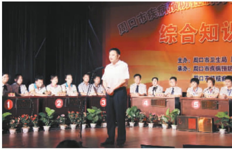
周口市卫生局局长郝宝良在综合知识电视竞赛现场致辞。

和健康教育等综合性知识。 最后,根据此前理论笔试、实践技能竞赛和综合知识电视竞赛的综合成绩,评选出一等奖1名、二等奖2名、三等奖3名、优秀组织奖3名和14名先进个人。郝宝良等领导为参赛队和队员颁发奖牌和证书。 此次岗位练兵和大比武活动,通过以赛促学、以赛促练,在全市掀起了疾控中心工作人员学知识、强技能的热潮,进一步提高了我市疾控系统在传染病防控、突发公共卫生事件应急响应与个体防护、实验室建设和结核病防控等方面的能力和水平,为全面打造一支高素质、高水平的疾病防控队伍,开展疾病预防控制工作奠定了扎实基础。 (邓莉)