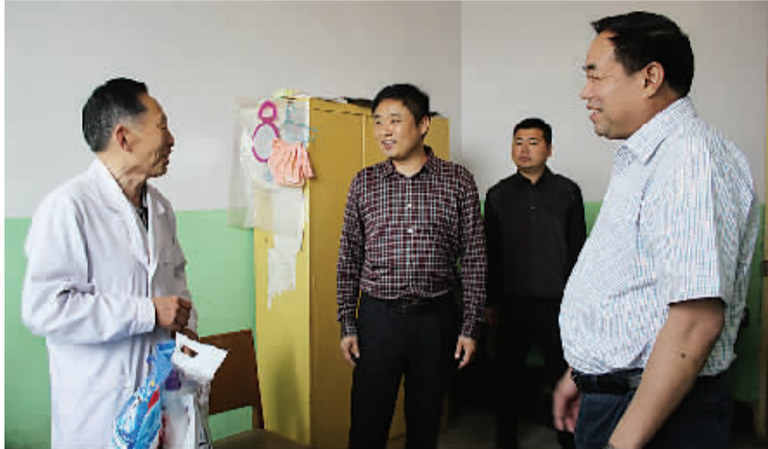
院领导慰问医护人员

鹿邑县人民医院是该县唯一一家二级甲等综合性医院,该院始建于1950年,占地21900平方米,业务用房建筑面积18000平方米。现有职工690人(其中专业技术人员560人),高级职称人员38人,中级职称人员102人,初级职称人员385人。编制床位304张,实际开放床位900张,是集医疗、预防、急救、教学及科研于一体的综合性医院,是鹿邑县三级医疗网的核心,承担着全县的公共卫生职能,是该县职工医保定点医院及新型农村合作医疗定点医院。