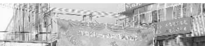
图2:全区积极组织各类社区文化娱乐活动,使社区群众自发组成了秧歌、唢呐、腰鼓、武术等近60支文艺表演队和50支体育活动队。图为文艺表演队正在进行表演。