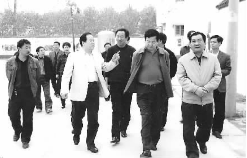
市领导在毛庄镇一中调研