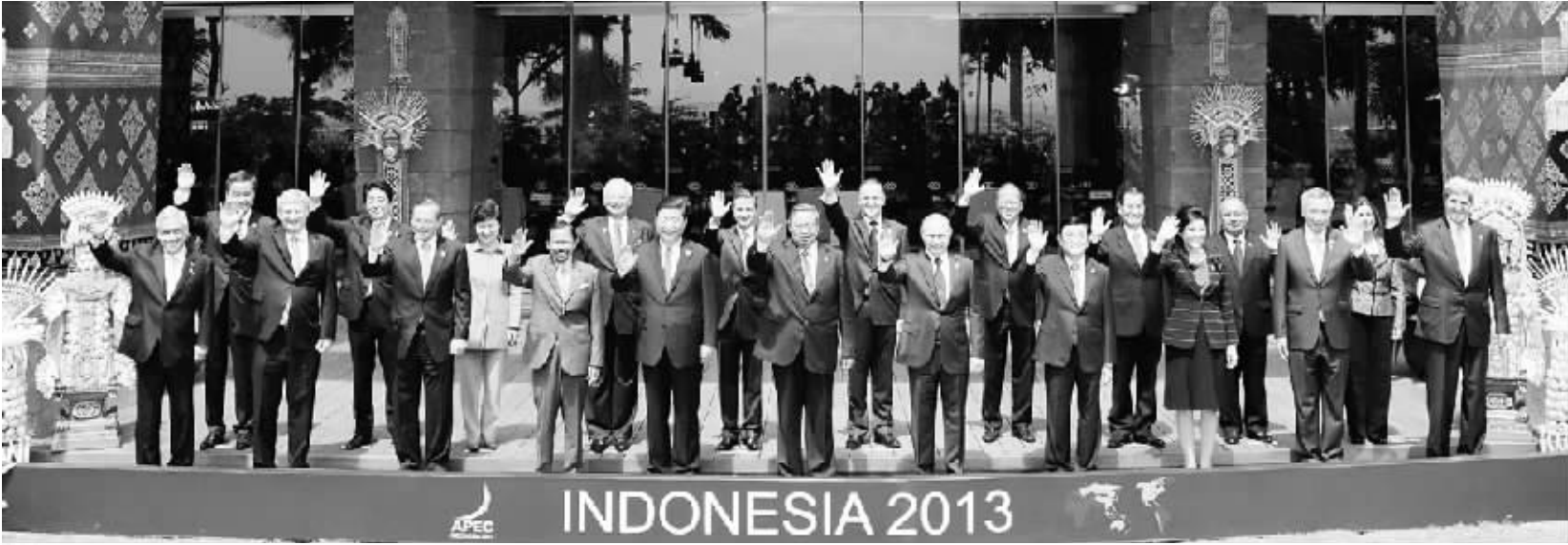
习近平出席亚太经合组织工商领导人峰会并发表重要讲话