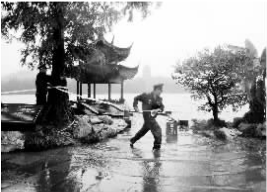
“菲特”带来强降雨 西湖景区被淹 10 月 8 日,在杭州西湖景区长桥景点,工作人员在拉警戒线。当日,受到台风“菲特”带来强降雨影响,杭州西湖超过警戒水位,景区多处景点被淹,无法向游客开放。

9 月 2 日,由中共中央纪律检查委员会、中华人民共和国监察部主办的综合性政务门户网站中央纪委监察部网站正式开通。