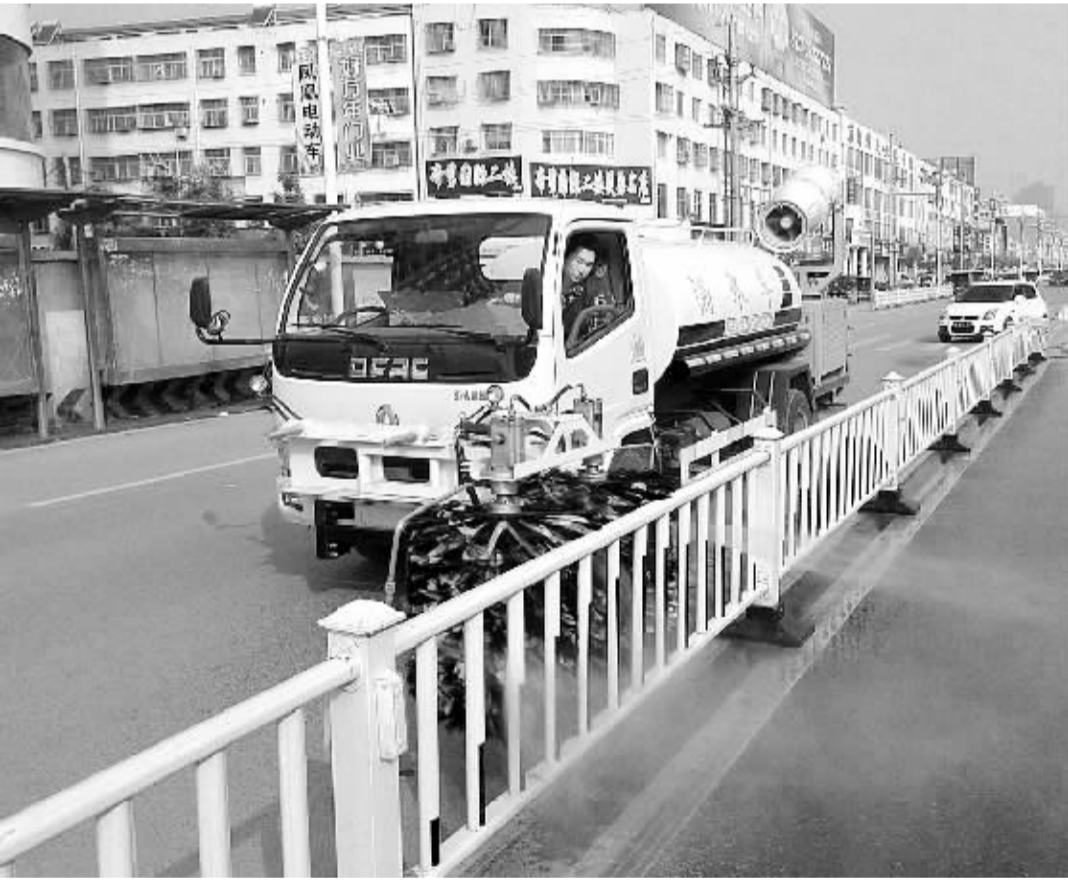
近日,商水县城管局多方筹备资金,为城市管理监察队增添一台全自动护栏清洗机,既提高了工作效率,减少了人力投入,又节约了用水,为建设美丽商水提供了有力保障。

中国国民党革命委员会(简称“民革”),于1948年1月1日在香港正式成立,由中国国民党民主派和其他爱国民主分子创建,具有政治联盟特点、为社会主义服务的政党,是中华人民共和国现有的民主党派之一,发展对象是同原中国国民党有关系的人士、同中国国民党革命委员会有历史联系和社会联系的人士、台湾各界有联系的人士及其他人士。1997年12月,民革河南省委员会直属周口支部第一届委员会成立;2008年2月,民革河南省委员会直属周口支部二届委员会成立;2012年7月,民革周口市委筹委会成立,2013年11月14日,召开民革周口市第一次代表大会,选举产生了民革周口市第一届委员会。