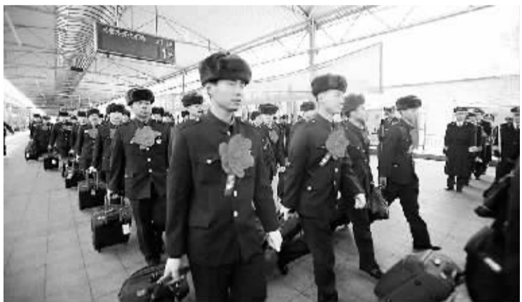
新疆军区首批1200余名老兵启程返乡 11月22日,来自新疆军区阿勒泰军分区、博尔塔拉军分区和塔城军分区的1200余名老兵踏上火车启程返乡。为确保此次老

兵运送工作顺利进行,新疆军区及早安排、科学筹划,各部门通力合作,让复员老兵走得安心、路上放心、回家欢心。