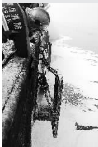
11月22日,消防人员在处理事故现场。

据新华社青岛11月22日电(记者徐冰)青岛市经济技术开发区工委宣传部提供的消息,据消防部门不断搜救和卫生部门最新统计,截至18时,青岛市经济技术开发区中石化输油管道爆燃事故已造成35人死亡,其他伤亡情况正在核实中。