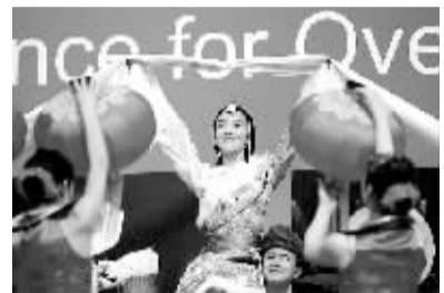
“文化中国”艺术团在印度举行慰问侨胞专场演出 12月15日,云南红河彝族哈尼族自治州歌舞团的演员在印度首都新德里为侨胞表演民族舞蹈。当天,数百名华人华侨、留学生、中资企业员工、驻印记者、使馆馆员及家属观看了演出。

安理会14日发表媒体声明,强烈谴责联合国马里多层面综合稳定团(马里稳定团)遭袭一事。安理会重申对马里稳定团和对其提供支持的法国军队的全力支持,并呼吁马里政府迅速调查袭击事件,将袭击者绳之以法。