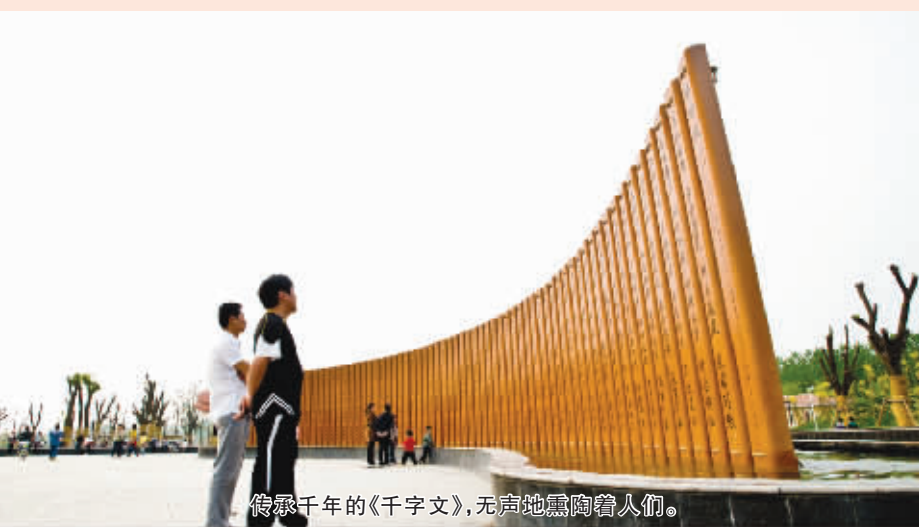
传承千年的《千字文》,无声地熏陶着人们。

扑蝶舞自清朝嘉庆年间形成,至今已有 200 余年的历史。经过 200 余年的洗涤,目前全国只有沈丘县槐店回族镇遗存着这一悠久的舞蹈。沈丘扑蝶舞以它原生态的稀有性、反对建礼教的思想性、曲折爱情故事的传奇性、诙谐幽默的娱乐性和具有 200 多年发展的历史,得到了该县文化主管部门的关注和保护,也获得了不少大奖。1953 年,沈丘扑蝶舞表演队代表河南省民间艺术晋京参加全国民间文艺汇演,荣获二等奖;1963 年赴商丘专区观摩表演,获一等奖,同年赴郑州参加全省民间文艺汇演,获一等奖;1984 年参加河南省第五届民族民间音乐舞蹈汇演,获舞蹈组一等奖;1989 年,被河南省选派晋京参加中国第二届艺术节群众艺术演出,荣获金奖。