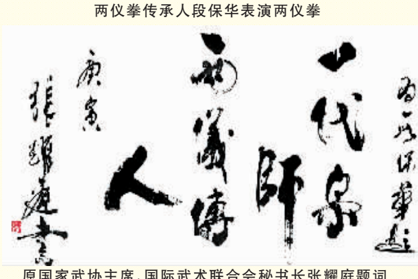
原国家武术协主席、国际武术联合会秘书长张耀庭题词