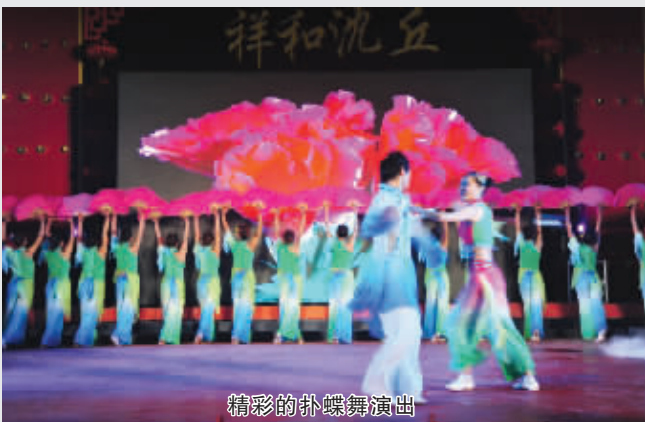
精彩的扑蝶舞演出

扑蝶舞又称“放蝶”,它的起源蕴藏着曲折动人的爱情故事。扑蝶舞长期流传于豫东广大地区,其复杂的表演方式和曲折的爱情故事令人喜爱,在豫东地区闻名遐迩。