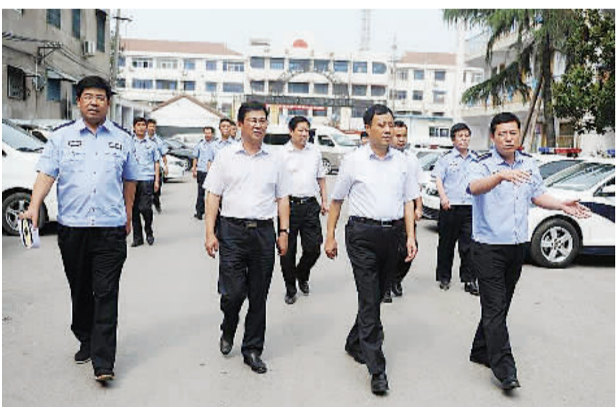
县委书记刘广明到公安局调研