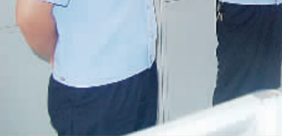
公安局局长陈凤祥、政委赵红建深入一线走访“正风肃纪”工作

打击食品犯罪,保卫餐桌安全。该所对本辖区内的食品店面进行全面样品提取工作,发动群众提供举报线索,对检测出违法使用禁用添加剂的重大违法犯罪嫌疑人追根溯源,侦破了一批食品犯罪案件。