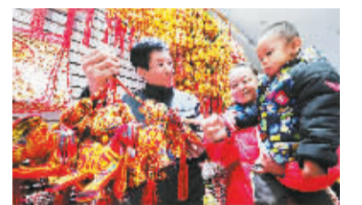
新年饰品热销 1月1日,在宁夏银川一家小商品市场内,顾客在选购新年装饰品,当日是2014年元旦。