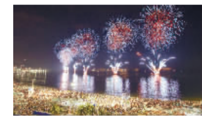
里约热内卢:海上焰火迎新 2014年1月1日,焰火在巴西里约热内卢科帕卡巴纳附近的海面上绽放,庆祝新年的到来。