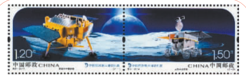
《中国首次落月成功纪念》邮票发行 《中国首次落月成功纪念》邮票特别发行首发式2014年元旦在京举行。邮票1套2枚面值共2.7元,邮票内容分别为嫦娥三号着陆器和“玉兔”号月球车。这是《中国首次落月成功纪念》邮票单枚图。新华社发

习近平指出,提高国家文化软实力,要努力提高国际话语权。要加强国际传播能力建设,精心构建对外话语体系,发挥新兴媒体作用,增强对外话语的创造力、感召力、公信力,讲好中国故事,传播好中国声音,阐释好中国特色。对中国人民和中华民族的优秀传统文化和光荣历史,要加大正面宣传力度,通过学校教育、理论研究、历史研究、影视作品、文学作品等多种方式,加强爱国主义、集体主义、社会主义教育,引导我国人民树立和坚持正确的历史观、民族观、国家观、文化观,增强做中国人的骨气和底气。