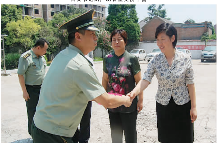
县长罗文阁慰问消防官兵