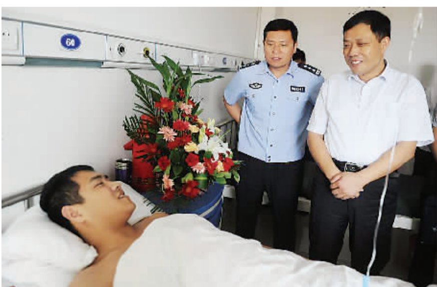
县委书记刘广明看望受伤干警