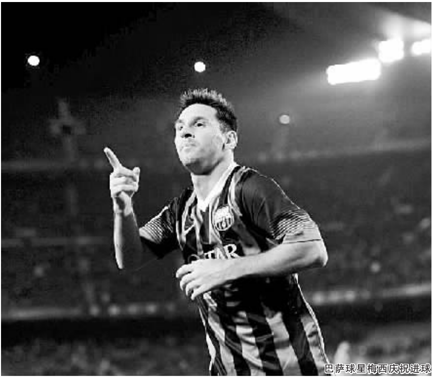
巴萨球星梅西庆祝进球

传，蒙托亚插上造成门前混战，梅西机敏的捕捉到机会推射破门，和往常一样，他控球，迅速射门，收获了自己复出后也是新年的首个进球。进球后梅西双手指天，又向自己的好友平托致敬。 在重新找到进球后，梅西还想扩大自己的账户。他主罚直接任意球，可惜皮球被人墙挡出，加时阶段，宋送出纵深传球，梅西右路拿球后一路狂奔，对方球员根本无力拦截，他突入禁区劲射破门，上演梅开二度的好戏。对梅西来说，这是典型的梅式狂奔进球，也是他最好的回归方式。 梅西在复出后给出的感觉是再好不过的了。他看上去很放松，但同时也有踢球的欲望。他非常兴奋地带球场上奔跑，积极与队友配合，寻找进球的感觉。在场上，梅西也展现了力量与能量，无论是在加速奔跑还是与对手拼抢、射门的时候都是如此。 现在的问题是梅西是否该在周六对马竞的比赛中首发。巴萨 10 号距离最佳水准只有一步之遥，但国王杯最后阶段 30 分钟的上场时间和联赛的 90 分钟上场时间是不同的。对马竞这样的对手，巴萨从第一分钟起就会感受到压力，梅西也必定会遭遇对方的严密盯防。不过，在梅西找回感觉的情况下，谁敢取消他哪怕一分钟的上场时间？马蒂诺或许拥有最后的发言权，但梅西已经在球场上说话了：我要上场。 (伊万)