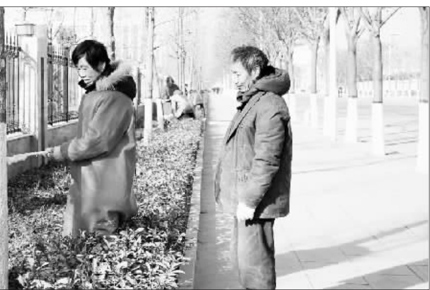
为抵御寒冷干燥天气,项城市组织技术人员对沿街绿化花木进行管护,确保了各类苗木安全越冬。图为工人正在进行冬季花木管护。

内容为:输送管道是否符合国家相关产品质量要求,是否存在腐蚀、破损、开裂、变形、老化和跑、冒、滴、漏现象;油气及危险化学品管网是否配备压力、流量等信息不间断监测系统,泄漏报警和紧急切断装置运行是否正常;输送管道企业安全生产主体责任是否落实,安全生产法律法规、标准和规范是否认真执行;输