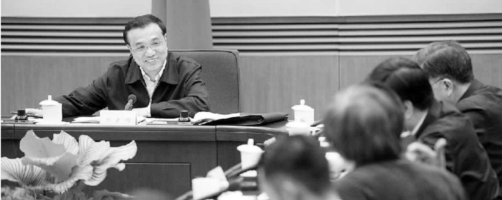
1月17日，国务院总理李克强在北京中南海主持召开座谈会，听取教育、科技、文化、卫生、体育界人士和基层群众代表对《政府工作报告(征求意见稿)》的意见和建议。