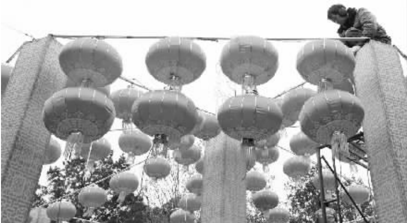
济南：传统灯会环保节俭迎佳节 1月19日，工人循环使用去年的材料搭建灯棚。已连续举办34局的济南市趵突泉灯会今年大量选用新型节能光源，花灯电线、钢结构等零部件实现循环再利用，在营造欢乐节日氛围的同时，宣传“环保节俭”的理念。

二站年产超稠油超过100万吨，成为我国首个百万吨级超稠油采油站。 据介绍，超稠油是指温度低于80摄氏度就会凝固的原油，因极粘稠而很难被开采，是世界上公认的原油开采难题。准噶尔盆地西北缘的风城油田蕴藏着超稠油，其粘度甚至超过世界稠油的平均水平，用常规稠油开发方式无法实现有效开发。新疆油田公司依靠研发的高新技术解决了这一难题。截至目前，风城油田超稠油储量达到4.2亿吨。