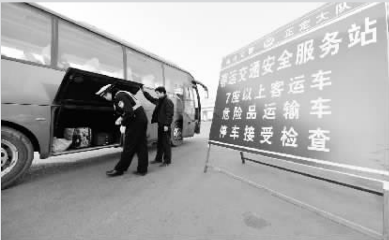
1月19日，在石家庄市绕城高速石家庄北收费口，交警对客车行李舱进行检查。

临近春节，在外辛苦一年的人们陆续踏上回家过年的路。一张小小的车票，寄托着他们的思乡之情；一句温馨的问候，带给他们旅途的温暖。春运期间，各地各部门采取一系列措施，协力保障旅客安全顺利返乡。