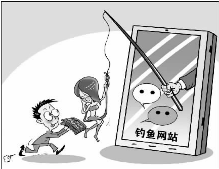
漫画：钓鱼 用微信摇美女，没见着人竟还被骗数百元。网友刘先生最近向360网购先赔反馈，他通过微信认识一个“美女”后，看到对方在朋友圈分享美食团购信息，便下单购买想借机约会。没想到，这个团购链接竟是钓鱼网站，所谓“美女”头像也是网上流传的校花生活照。360安全专家表示，微信朋友圈已成为新兴的钓鱼渠道，网友玩微信应警惕陌生人发布的购物信息。 朱慧卿 作

例，对一般性支出进行了压减。各市也大幅压减一般性支出，其中长治市级“三公”经费下降25%，吕梁市级公务接待费下降54%，朔州市级会议费用下降44%。全省压减下来的3.49亿元资金集中用于100座小水库和农村救灾房屋建设。 山西省财政厅表示，山西省将出台“三公”经费管理和公开的规定，省直机关会议费、差旅费、培训费和出国经费管理办法，行政单位资产配置标准及行政事业单位资产出租出借办法等一系列制度。