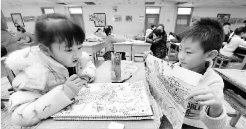
“小马鸣春”迎新春 1月19日，在银川市青少年宫内，参加“小马鸣春”儿童绘画大赛的两名小朋友在欣赏对方的作品。当日，银川市少年宫举办“小马鸣春”迎新春少儿绘画大赛。银川市500余名参赛的“小画家”以“小马鸣春”为主题进行创作，用充满童趣的画作迎接春节的到来。

开展户口清理整顿，健全完善户口、身份证管理制度，加快推进人像比对系统建设，共发现和注销了79万个重复户口，查处了一批违法违纪人员。 黄明表示，各省市要加快人像比对系统建设步伐，公安部将建立部级人像比对系统，实现全国范围的人像自动比对和纠错，未来只要有人办假户口、假身份证，都能够及时发现和查处。