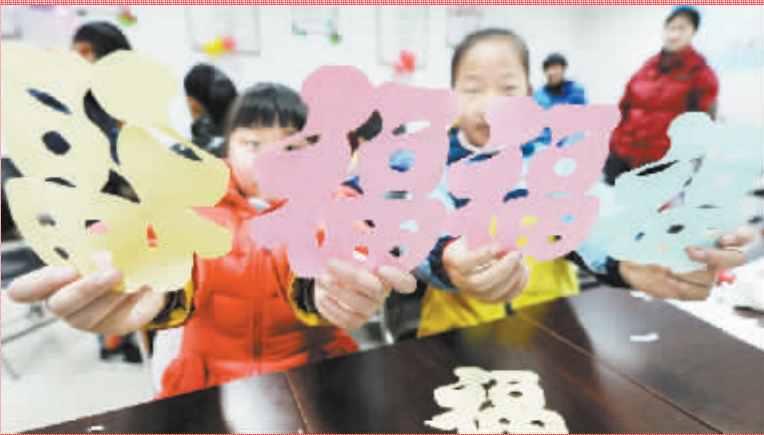
杭州:写春联 送祝福 1月22日,11岁的鹿雅楠(左)和小朋友一起展示自己剪的“福”字。当日,在杭州市望江街道婺江社区,30多位社区的小朋友聚集在一起,写春联,剪福字,并与社区工作人员一起把写好的春联和福字送到社区的高龄或孤寡老人手中,在春节即将到来之际,为他们送上新春祝福。