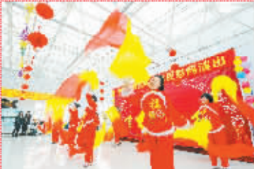
养老院内喜迎新春 1月21日,长春市妇联巾帼家政公司的爱心志愿者在联欢会现场表演舞蹈。当日,长春市温馨养老院联合爱心志愿者,共同为温馨养老院内的200多名老人献上了一场新春联欢会。