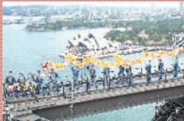
中国传统舞龙亮相悉尼海港大桥 1月21日,舞龙表演者在澳大利亚悉尼海港大桥上表演。当日,由当地华人团体精心准备的中国传统舞龙亮相悉尼海港大桥,拉开中国新年庆祝活动的序幕。