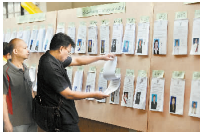
泰国大选提前投票 多地投票站受扰关闭 1 月 26 日,在泰国首都曼谷邦拉区,选民在一个投票站查看候选人信息。泰国大选提前投票当地时间 26 日上午 8 时在全国 375 个选区展开,共 200 万选民注册参加提前投票。曼谷和泰国南部大部分选区投票站遭到反政府示威者包围而关闭,投票被迫暂停。