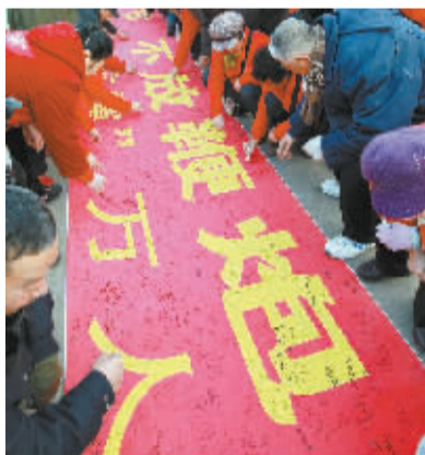
山东济南万人签名倡导文明过节 1 月 25 日,在山东济南战役纪念馆门前广场,市民在倡导文明过节的横幅上签名。