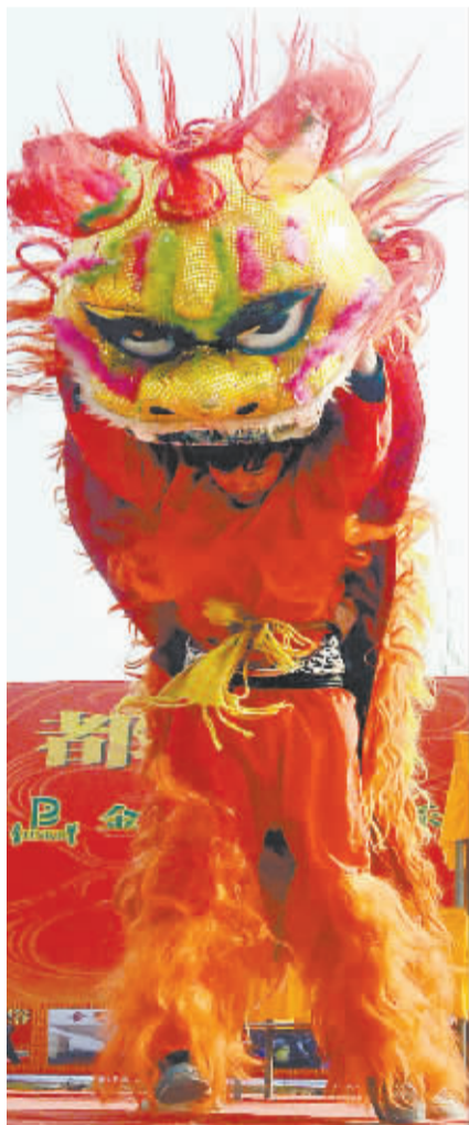
郑州庙会展示民俗文化 1 月 26 日,狮舞演员为游客表演高难度动作。当日,2014 郑州商都民俗庙会暨郑州金鹭鸵鸟园景区开幕。