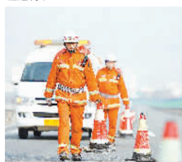
应急救援保春运 1 月 26 日,甘肃天水高速清障救援一大队队员正在救援现场设置安全锥。为保障春运期间高速公路畅通和行车安全,甘肃省高速公路管理局所辖的各高速清障救援大队均放弃了节假日休息,队员们坚守一线,在甘肃省内 3000 多公里的高速公路上全天候巡查,为“平安春运”保驾护航。