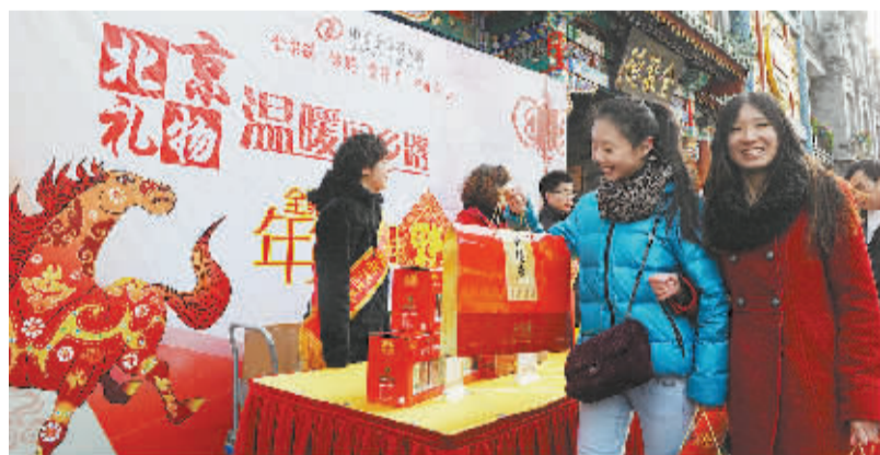
喜庆年货温暖回乡路 1 月 26 日,顾客在北京前门大街全聚德烤鸭店年货售卖点选购年货。当日,“北京礼物”温暖回乡路——年货送福活动在北京举行。北京全聚德、丰泽园等中华老字号餐饮企业,在线上线下 500 余个年货销售终端,开卖烤鸭、年糕等 8 大类传统特色年货,为即将到来的马年春节增添喜庆祥和之气。