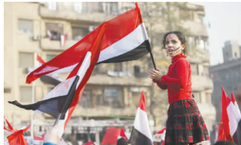
埃及民众庆祝推翻穆巴拉克政权三周年 1 月 25 日,在埃及首都开罗解放广场,一名女孩在庆祝推翻穆巴拉克政权三周年“纪念日”的活动中挥舞埃及国旗。当日是埃及推翻穆巴拉克政权三周年“纪念日”。

有关争吵与和解,本周中国国内也有一个话题。春节要到了,年轻夫妻该去谁的父母家过年在网络上引起人们热议。如果两人各执己见,互不相让,只会造成对抗乃至家庭危机。如果双方多点相互体谅,不难找到和平解决的方案。有人说,家是讲爱和理解的地方,不是讲理的地方。其实,放到更大的范围,国与国、族群与族群之间,不也有类似之处? (新华社北京 1 月 26 日电)