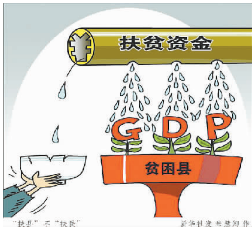
“扶县”不“扶民” 新华社发 朱惠理作

新华社 25 日受权发布《关于创新机制扎实推进农村扶贫开发工作的意见》。《意见》从战略和全局出发,把扶贫开发工作摆到了更加突出的位置,并对当前和今后一个时期扶贫开发工作作出明确部署。《意见》提出的改进贫困县考核机制、建立精准扶贫工作机制、改革财政专项扶贫资金管理机制三大看点尤为引人注目。