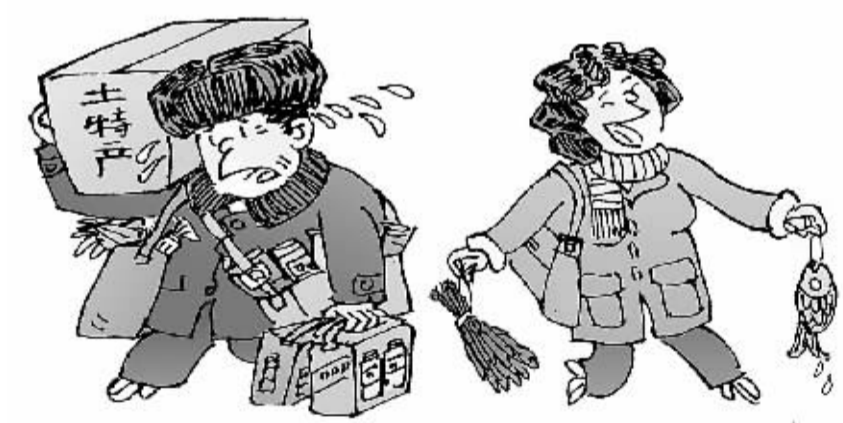
以前购货习惯囤积 现在购货现吃现买 购年货,看变化 新华社发 蔡跃新 作

度和责任追究制度。这些制度的设计和实施,除教育部门之外的其他方面参与至关重要。比如一开始划片时就应邀请第三方专业机构和家长代表参与,既可以监督教育部门实施权力,又可以事后分担教育部门的压力。 邀请哪些机构、哪些家长参与,参与到什么程度,弹性很大,事关过权力“险滩”。如果像一些地方调整物价时只请赞成者参加,等于自甘陷身“险滩”,必陷入质疑泥潭。相反,教育部门主动还权社会,请有公信力的第三方组织和有责任心有能力的家长代表,积极参与小升初免试就近入学全过程,则有望实现全面阳光招生。 (新华社北京1月27日电)