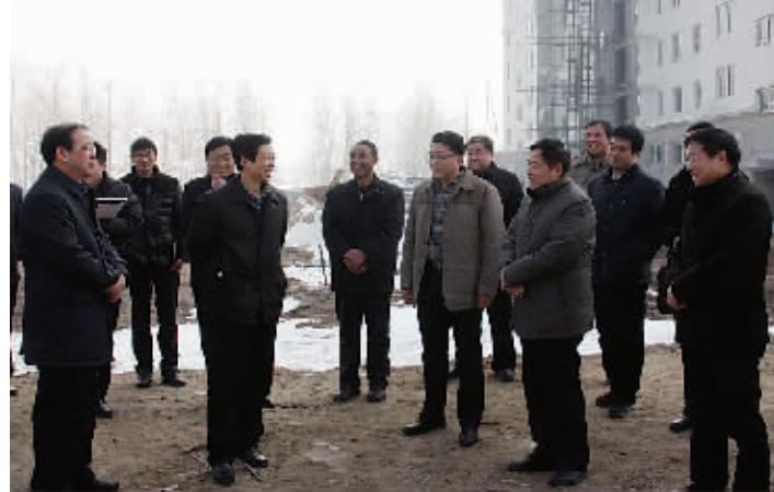
市委常委、组织部长、港区建设指挥部指挥长李明方,市委常委、副市长、港区建设指挥部副指挥长刘国连深入周口港口物流产业集聚区安置社区未来家园工地,现场调研工程进展情况。