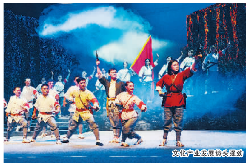
文化产业发展势头强劲

着力推进开放招商增后劲 着力推进可持续发展保生态 着力推进改革开放添活力 着力推进文化建设促繁荣 着力推进民生改善筑和谐