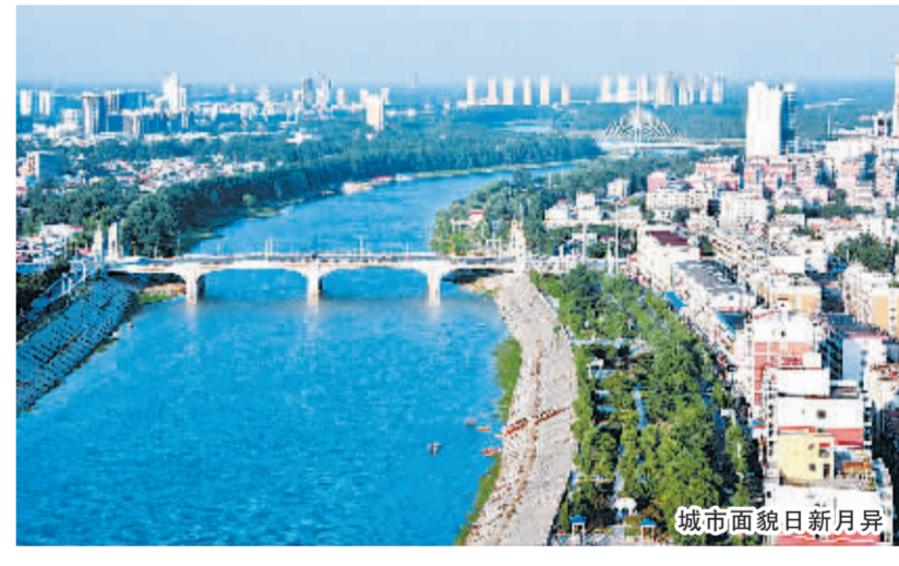
城市面貌日新月异