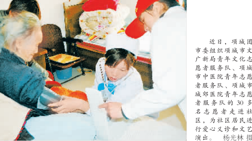
近日,项城市委组织项城市文广新局青年文化志愿者服务队、项城市中医院青年志愿者服务队、项城市城郊医院青年志愿者服务队的30多名志愿者走进社区,为社区居民进行爱心义诊和文艺演出。