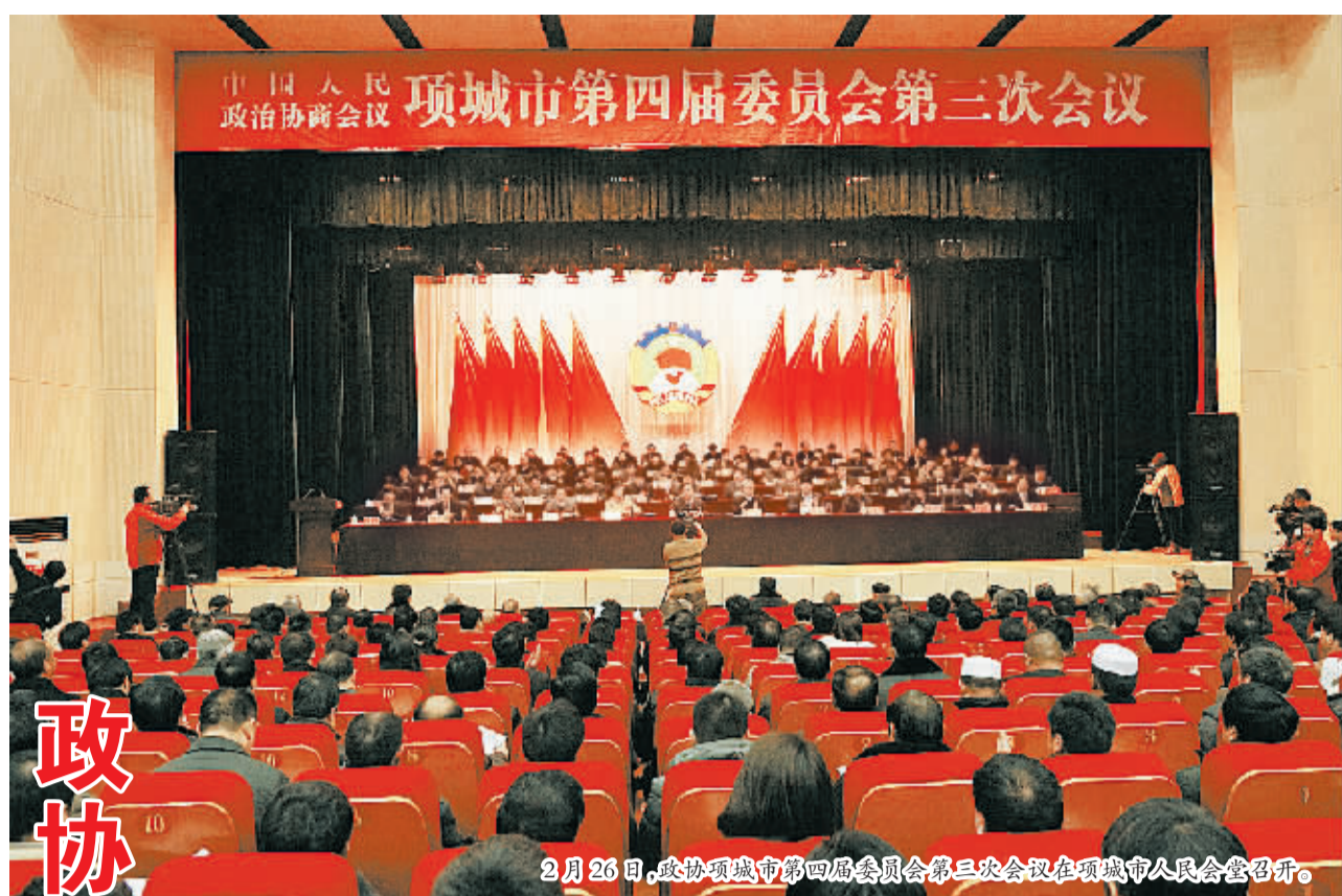
2月26日,政协项城市第四届委员会第三次会议在项城市人民会堂召开。