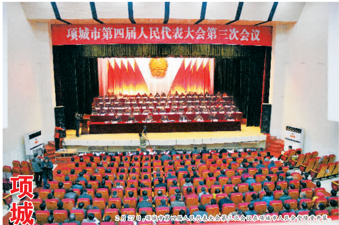
2月27日,项城市第四届人民代表大会第三次会议在项城市人民会堂隆重开幕。