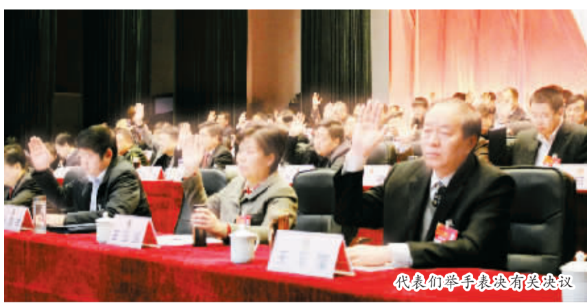
代表们举手表决有关决议

在城乡建管中,打造了广泛认同的良好形象。城南新区建设全面提速,迎宾大道贯通工程全面启动。城市品位明显提升,完成了城区8条道路的绿化提升工程,新增、改造绿地90万平方米,城镇化率达到40.87%,顺利通过省级文明城