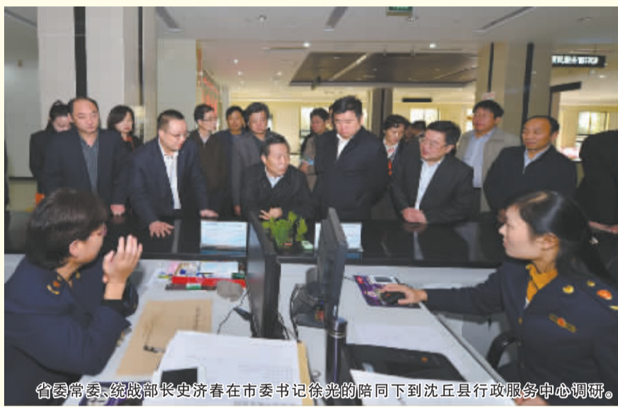
省委常委、统战部长史震在市委书记徐光的陪同下到沈丘县行政服务中心调研。