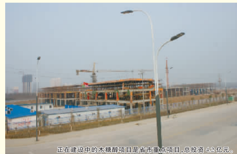
正在建设中的木糖醇项目是省市重点项目,总投资4.2亿元。