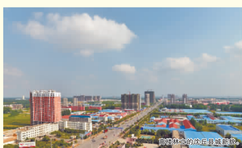
高楼林立的沈丘县城新貌。