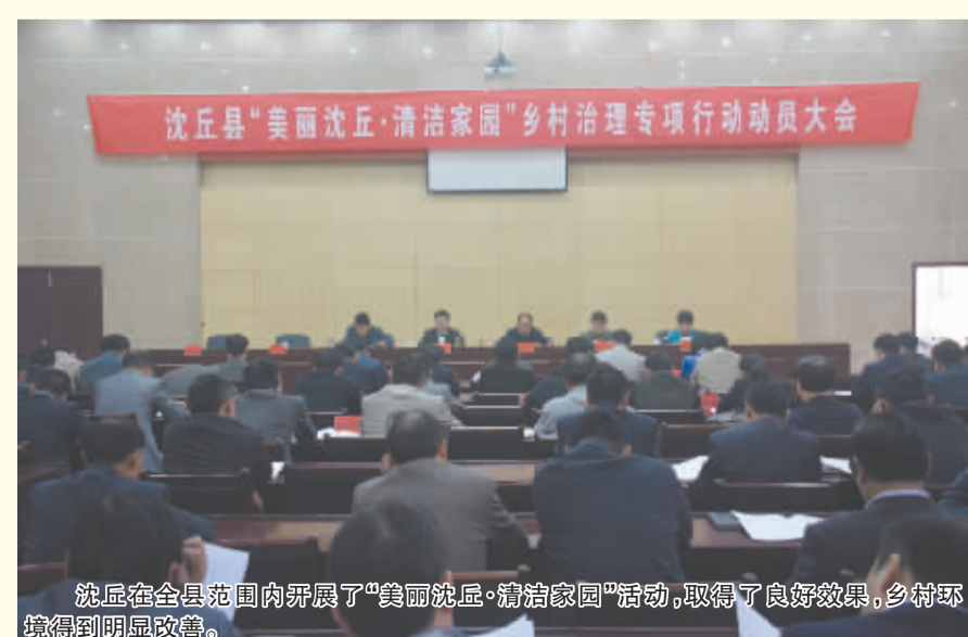
沈丘在全县范围内开展了“美丽沈丘·清洁家园”活动,取得了良好效果,乡村环境得到明显改善。