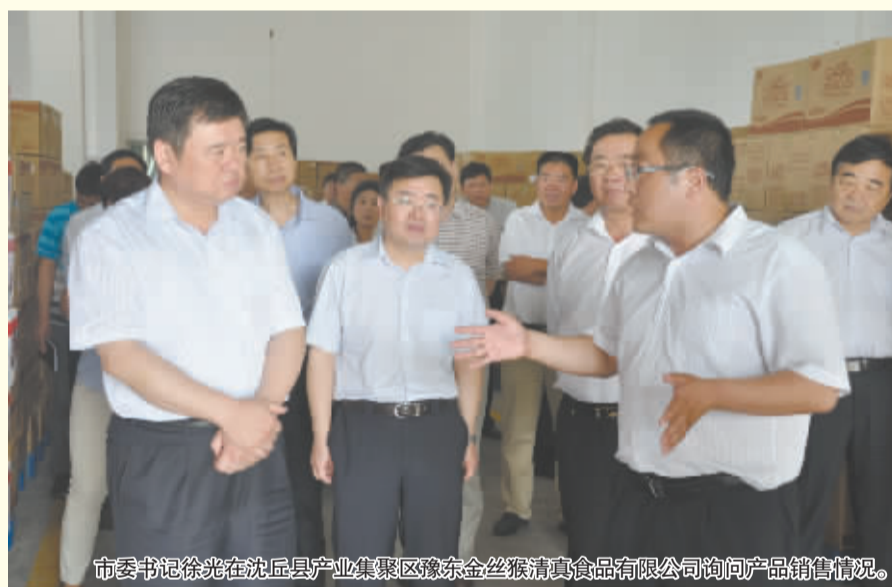
市委书记徐光在沈丘县产业集聚区豫东金猴清真食品有限公司询问产品销售情况。