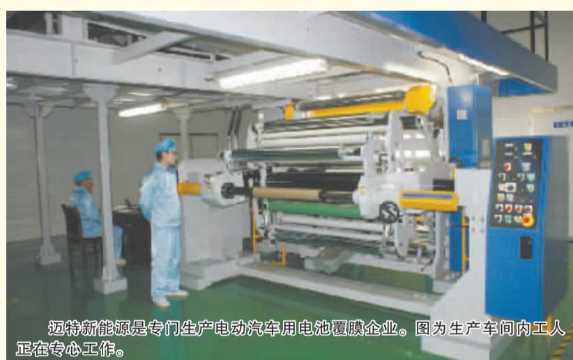
迈特新能源是专门生产电动汽车用动力电池覆膜企业。图为生产车间内工人正在专心工作。