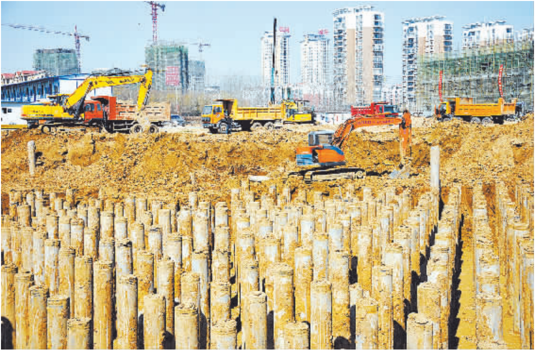
由周口报业传媒集团和河南昌建地产有限公司联合开发的MOCO新世界工程项目,正加速推进。该项目为市重点工程之一,位于周口东新区核心位置,依托周边市政、金融、教育、文体等资源优势,将业态规划为星级酒店、商务办公、布提克精品公寓、休闲娱乐商业等,是我市首家引入“MOCO”概念的商务文化城市综合体项目。

以产业集聚区建设为突破口,抓大扶强工业产业。科学规划产业集聚区面积15.5平方公里,建成区面积达10.3平方公里。累计投资14.5亿元统筹推进产业集聚区的路、水、电、气等基础配