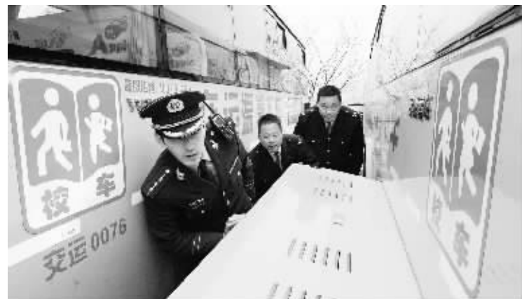
青岛:校车安全无小事 3月25日,青岛市崂山公安边防大队民警在对校车进行安全设备检查。近日,青岛市公安局、交警等部门联合开展“安全无小事 车厢变课堂”活动。在加强校车安全检查和司乘人员安全培训的同时,在全市1500辆校车上张贴安全宣传材料并播放安全教育视频,向学生普及和宣传交通安全、消防逃生等知识。

同策咨询研究部总监张宏伟分析称,地方政府提高二套房贷款首付比例,意味着会增加购房者或投资客进入市场的门槛,可能会对于部分人群尤其是首次改善置业的人群产生较大影响,导致这部分需求后置。他认为,正是在这种背景下,开发商选择“垫首付、分期首付”的方式来规避政策,刺激被抑制的市场需求。