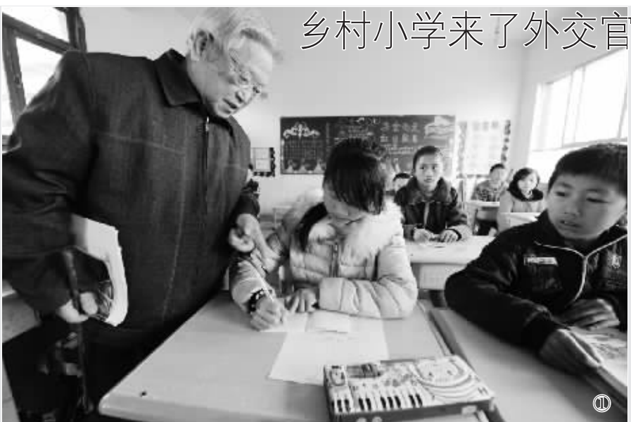
乡村小学来了外交官