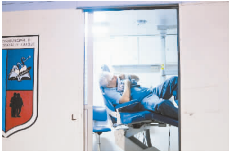
4月2日,在智利伊基克一座体育场临时搭建的疏散中心,一名受伤的男子等待治疗。

据新华社圣地亚哥4月2日电(记者冷彤 李丹)智利官员2日确认,该国北部海域发生的8.2级地震已导致5人死亡。