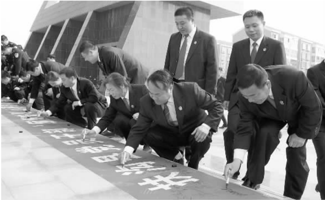
近日,为深入开展党的群众路线教育实践活动,扶沟县法院组织法官到吉鸿昌将军纪念馆开展“缅怀先烈、心系群众、争做为民务实清廉的优秀法官”活动,以吉鸿昌将军“做官即不许发财”的信条激励法官公正司法、一心为民。图为签名活动。