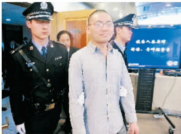
网络红人“秦火火”诽谤、寻衅滋事案昨开庭审理。4月11日，秦志晖被带入法庭。当日，备受关注的网络红人秦志晖(网名“秦火火”)诽谤、寻衅滋事一案在北京市朝阳区人民法院依法公开开庭审理。

确保国家粮食安全和人民群众“舌尖上的安全”具有重大意义。财政部农业司巡视员卢贵敏透露，今年中央财政已安排专项资金对湖南省试点地区给予补助，支持耕地保护与质量提升，让农民种上安全粮，让消费者吃上放心粮，推动农业可持续发展新战略的实施。