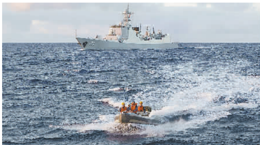
▲澳总理称澳方对疑似信号来自黑匣子很有信心 这张由澳大利亚国防部提供的照片显示，中国海军171舰的搜救人员乘坐小艇前往澳大利亚海军“成功”号军舰进行联络协调(4月9日报)。澳大利亚总理阿博特11日说，澳方对目前发现的水下脉冲信号来自马航失联航班的“黑匣子”很有信心。新华社发

“东海救101”及海军999、998、171舰继续在澳大利亚以西海域搜寻。“海巡31”及海军863舰继续在印度洋东部海域搜寻。“南海救101”向澳大利亚以西海域搜索前进。 4月11日12时，“海巡01”与“东海救101”完成现场指挥协调职责交接，前往澳大利亚奥尔巴尼港补给。在“海巡01”补给期间，“东海救101”将承担现场指挥船职责。