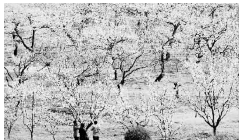
万亩梨花醉游人 4月16日,游人在辽宁北镇欣赏梨花。近日,素有“梨都”美誉的辽宁北镇市十万亩梨花进入盛花期,朵朵梨花迎风绽放,吸引大批游客前来赏花、登山、观景。

工商总局企业注册局分析指出,市场主体准入“门槛”降低后,社会投资较为理性,注册资本规模分布比较合理;新登记企业集聚在中小规模段,“一元企业”占比极小,未出现大量畸高畸低出资现象。