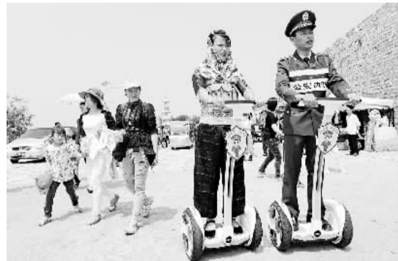
福建惠安:警民共建平安景区 4月16日,惠安县崇武边防派出所民警和女民兵组成的治安联防队使用新型手扶平衡车在崇武景区巡逻。近年来,崇武古城游客不断攀升,驻守在崇武半岛的边防官兵与当地群众在全国率先建立联防联控“旅游警务”模式,24小时处置各种突发事件和治安案件,创建平安旅游环境,确保游客生命财产安全。

答:制定出一个好文件,只是万里长征走第一步,关键还在于落实。领导小组办公室近期将从以下三个方面着手,推动《通知》有关政策落到实处、发挥实效。一是加强政策宣传解读和研讨培训,进一步提高政策知晓度,推动各方面熟悉了解政策。二是加强细化落实,抓紧制定出台实施细则,分解具体工作任务,推动有关政策尽快“落地”。三是加强跟踪督查,及时掌握各地各部门动态,评估《通知》执行效果,分析工作中出现的新情况新问题,研究制定新的政策措施,处理好同全局性经济政策的衔接。下一步,我们考虑还要适时出台促进电影发展、振兴地方戏曲、支持小微文化企业等方面政策,进一步优化文化改革发展环境。(据新华社北京4月16日电)