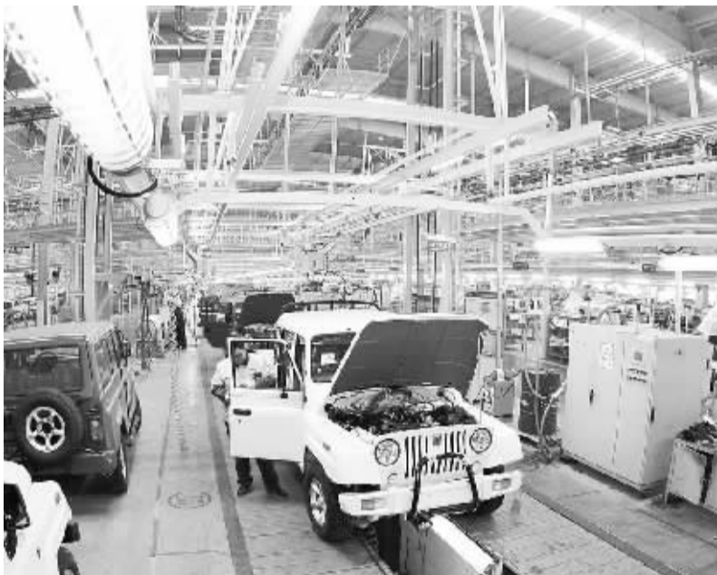
工人在北汽集团华北(黄骅)汽车产业基地生产线上工作(3月17日摄)。

7.4%,牵动人心的一季度中国经济增速16日公之于众。这一速度的确定是6个季度的新低,但与上季度相比降幅只有0.3个百分点。从开局增速中能看出怎样的中国经济走势,宏观政策又将如何应对?