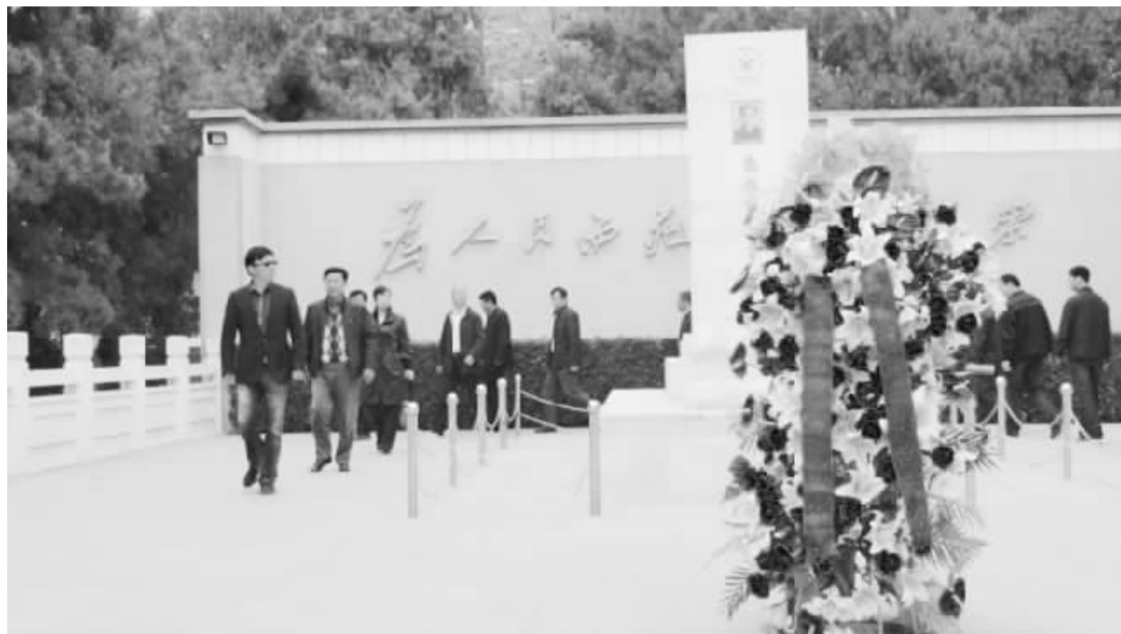
为大力弘扬焦裕禄精神,进一步深入开展党的群众路线教育实践活动,4月15日,市旅游局全体党员干部赴兰考瞻仰焦裕禄纪念馆,观看焦裕禄事迹展,重温焦裕禄事迹,缅怀焦裕禄功绩,学习焦裕禄精神。

有典型,明确焦裕禄、吴金印、李连成和广大党员干部身边的先进典型;注重搞好基层党员干部的学习,通过带着学、辅导学、现场学等多种形式,切实增强学习效果。通过学习,党员领导干部对群众路线教育实践活动精神有了进一步的理解和把握,对开展教育实践活动的重要性和紧迫性有了更深一步的体会和认识,全区党员干部的宗旨意识进一步牢固,群众观点和群众路线进一步坚定。(李守伟 王军华)