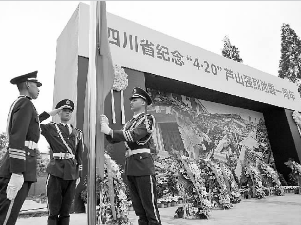
芦山一周年祭 4月20日,“4·20”芦山地震一周年纪念活动在四川省雅安市芦山县龙门乡隆兴中心校举行。当日是“4·20”芦山地震一周年纪念日。社会各界为“4·20”芦山强烈地震遇难者致哀。