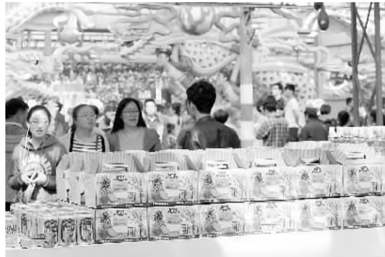
台湾农副产品惹人爱 4月20日,参观者在挑选台湾农副产品。当日,在山东寿光举行的第十五届中国国际蔬菜科技博览会上,来自宝岛台湾的农副产品吸引了众多参观者和客商的眼球。本届菜博会专设面积为7000平方米的“台湾馆”,展示包括农技、蔬果、花卉、农副产品、养生保健、台湾美食等内容,让参观者近距离体验台湾农副产品特色。

“为确保新商标法落实到位,我们配合国务院法制办开展了商标法实施条例的修订工作。年初,条例(修订草案)向社会公开征求意见后,已报国务院审议,有望在5月1日前公布实施。”国家工商行政管理总局商标局有关负责人吴群在会上说,该条例对商标注册申请、商标评审、商标专用权保护及商标代理等作出了新的规定。