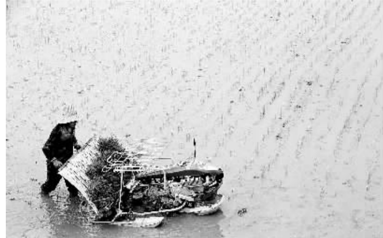
谷雨时节农事忙 4月20日,江西省宜春市靖安县仁首镇石下村农民在田间插秧。当日是农历二十四节气的“谷雨”。“谷雨”时节,我国大部分地区进入了春耕春播的关键时期。