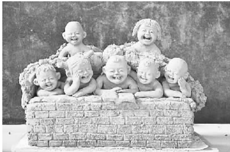
张振福获奖作品。

张振福告诉记者:“今后将围绕全省旅游商品、文化产业发展的整体思路,倾力打造郸城品牌,在宣传发动、强化培训、市场推介等方面下工夫,努力构建‘张振福泥塑艺术馆+泥塑工作室+传承泥塑艺术’经营模式,为做大做强周口文化产业作出新贡献。”