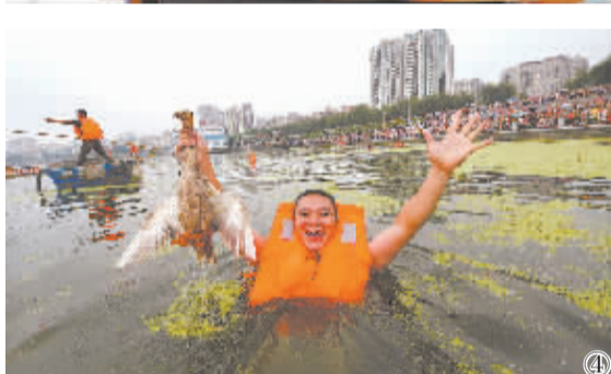
图4:6月2日,一名市民展示在遂宁市观音湖抢到的鸭子。当日,四川省遂宁市在观音湖举行“划龙舟抢鸭子”活动,市民可在湖中划龙舟,下水逮鸭子,被捉到的鸭子归个人所有。