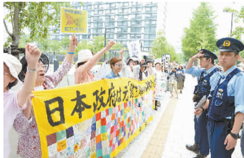
日本举行声援“慰安妇”示威

的外籍高层次人才,在中国有较高数额直接投资的外籍投资者,对我国有重大突出贡献或国家特别需要的人员以及夫妻团聚、未成年人投靠父母、老年人投靠亲属等家庭团聚人员,可以授予外国人永久居留证,即中国“绿卡”。 据统计,自我国实施“绿卡”制度以来,至今年5月23日,有1306名我国海外高层次人才引进计划(“千人计划”)引进的外籍人才及其家属以及各部委和省级人民政府推荐的高层次人才获得中国“绿卡”。