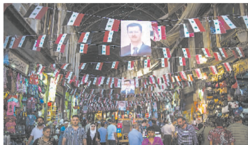
叙利亚大选进入倒计时

我们指出了一条充满希望的道路。现在是让位的最佳时机,是年轻的一代走到台前的时候了,他们精力充沛,坚定地顺应时代进行改革。我相信费利佩能够开启一个充满希望的时代。” 卡洛斯国王还对索非亚王后及在他担任国王期间历任政府官员和全体国民表示了谢意。他说:“回顾近40年的执政历程,我的心里充满了骄傲和对你们的感激。西班牙将永远在我的心中。” 现年76岁的卡洛斯国王于1975年登基,在位39年。