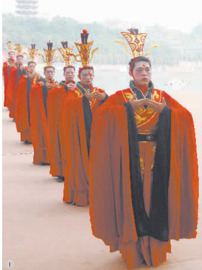
图1:6月2日,人们在安康汉江龙舟节开幕式上祭祀屈原。当日,第十四届安康汉江龙舟节在陕西省安康市开幕,29支参赛队伍在汉江上展开角逐,数千名观众聚集江沿岸,共庆端午佳节。