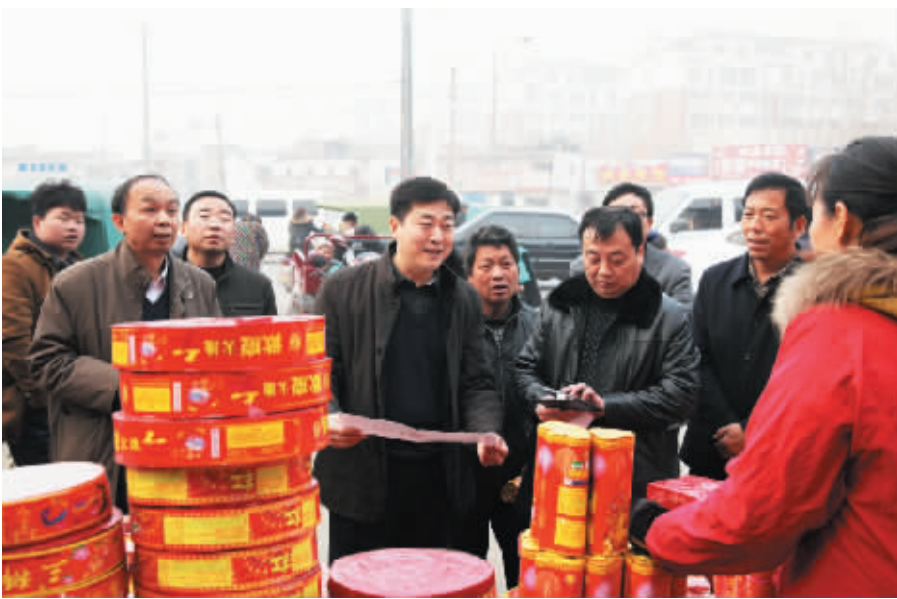
省安监局刘宛康局长检查周口市烟花爆竹经营市场