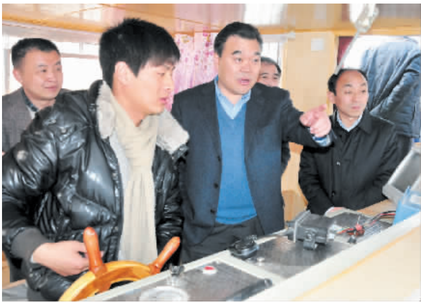
市长刘继标调研安全生产工作