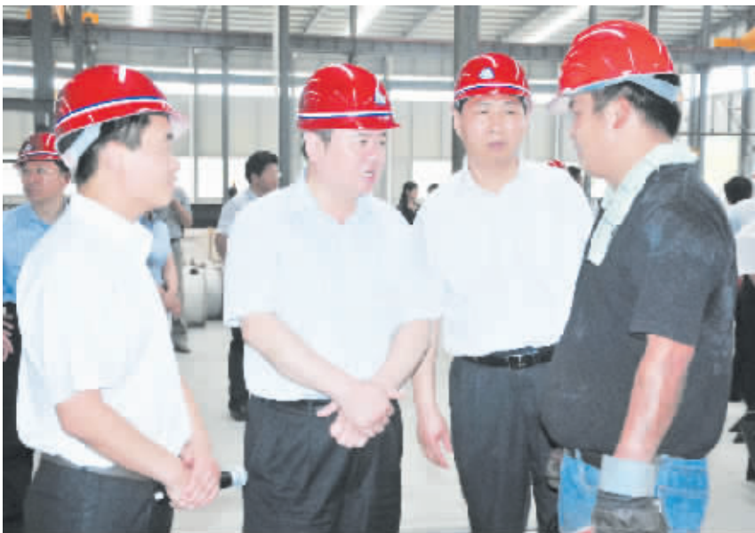
市委书记徐光调研安全生产工作