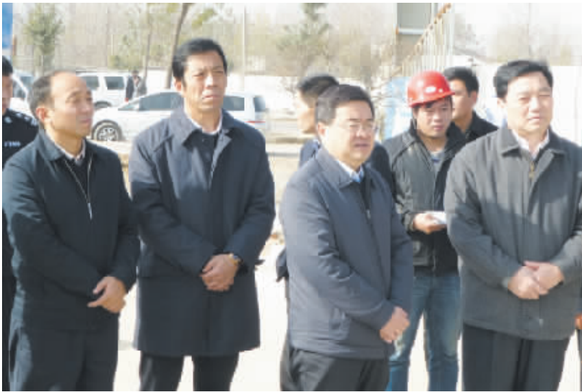
市人大常委会刘庆森在沈丘县调研安全生产工作