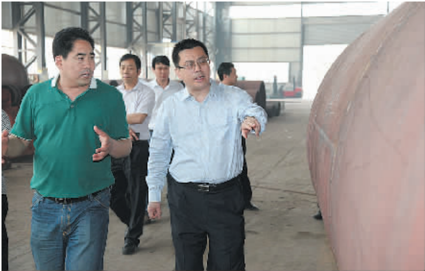
副市长刘政检查企业安全生产标准化工作