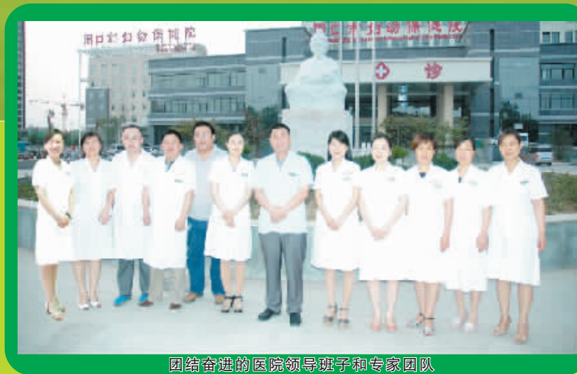
团结奋进的医院领导班子和专家团队