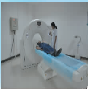
斥巨资引进的原装西门子螺旋CT。