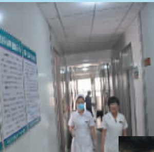
↑周口市儿童医院新设了发热门诊,规范操作流程。