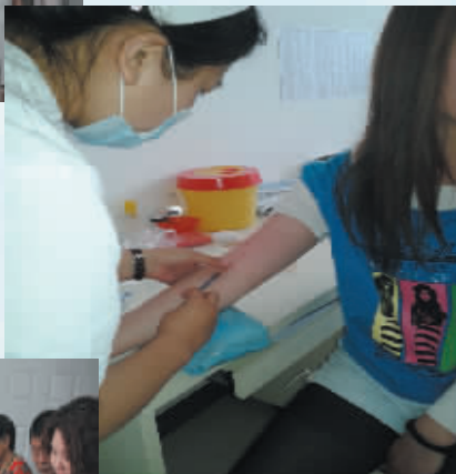
↑周口市妇幼保健院是全市唯一一家开展封闭抗体检测及淋巴细胞免疫的单位,治疗不明原因习惯性流产。