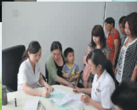
↑新门诊病房综合楼启用之后,前往该院治疗的患者比往常多了很多。