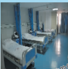
干净整洁的待产室。