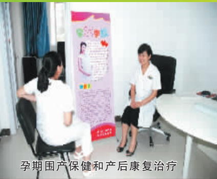
孕期围产保健和产后康复治疗