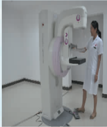
全球最高分辨率的西门子全数字化高档乳腺机(DR钼靶),目前全省仅三台。