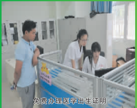
免费办理医学出生证明