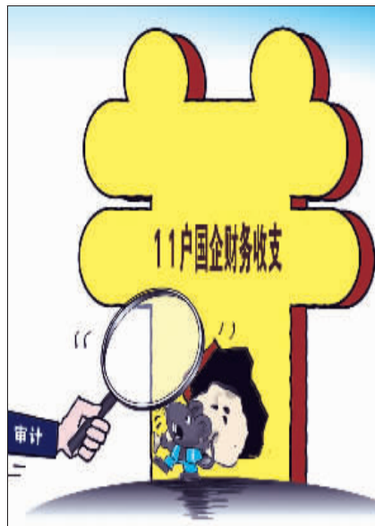
审计央企

法、效益情况,促进企业规范管理。 截至5月31日,相关企业制定完善规章制度1194项,对190名相关责任人进行了严肃处理,其中厅局级干部32人。同时,按照审计要求,企业已补缴各项税款1.78亿元,挽回和避免损失32.96亿元。对提出的62项审计建议,企业均已采纳。下一步,审计署将对企业整改情况进行检查,并将检查结果向社会公告。 此外,本次审计查出一些企业的个别人员涉嫌经济违法违纪线索,审计署已将有关案件线索移送纪检监察或司法机关立案查处,待查处结束后再予以公告。