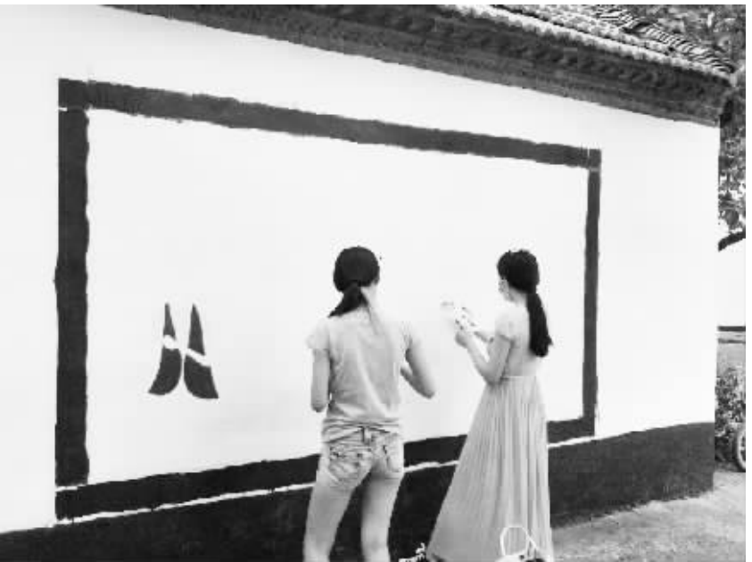
工作人员正在高店自然村的临街外墙上绘制文明宣传图

周口港口物流产业集聚区(简称周口港区)位于沙颍河南岸,紧邻中心城区,区内及周边交通发达,多种运输方式并存。作为河南省唯一一个以内河港口为依托的产业集聚区,周口港区让周口人更加期待明天的港城。你可曾注意到,每天,港区都有着变化,文明示范村内的柿子已挂满了枝头,垃圾箱遍布村内,临街居民的外墙进行了统一粉刷;“两违”行为得到了有效遏制……成绩的取得离不开港区工作人员的辛勤付出,他们如何提升城市管理水平,为辖区内居民的生活环境改善做出了哪些巨大努力?近日,记者进行了采访。