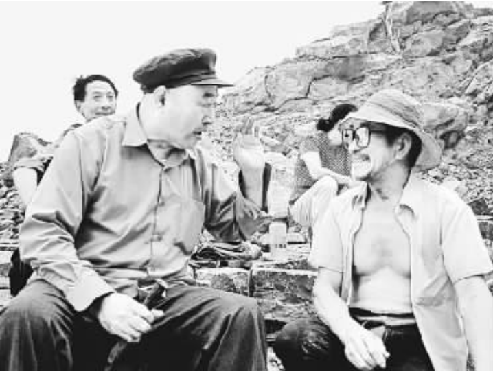
吴金印在造田工地上与群众拉家常。