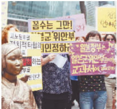
韩国民众在日本大使馆前举行多轮抗议示威活动 7月2日，在韩国首尔的日本驻韩国大使馆前，民众在慰安妇少女像旁手持标语参加抗议活动。当日，韩国民众聚集在日本驻韩国大使馆前，举行多轮抗议示威活动，要求日本政府向慰安妇谢罪，并强烈反对日本通过解禁集体自卫权的法案。