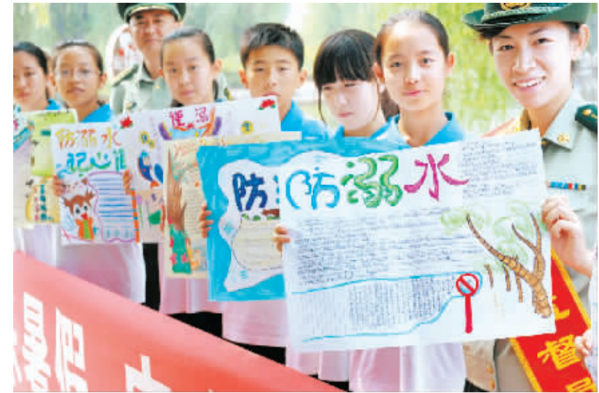
快乐暑假 安全同行 7月3日，同学们在“假期安全课堂”上展示防溺水手抄报。暑假来临，青岛李沧公安边防大队“校园安全监督员”加强了对辖区中小学生的安全教育，并开设“快乐暑假 安全同行”假期安全课堂，多种形式宣讲防止溺水、安全出行、灾害避险、防火防电等知识，为学生暑假生活保驾护航。

据新华社北京7月3日电（记者赵超 郑晓爽）国家电网公司3日宣布溪洛渡左岸—浙江金华±800千伏特高压直流输电工程正式投运，这是目前世界上输送容量最大的直流输电工程。 溪洛渡左岸—浙江金华±800千伏特高压直流输电工程简称溪浙工程，于2012年8月开工建设，途经四川、贵州、湖南、江西、浙江5省，是继向上、锦苏特高压直流工程之后，国家电网公司投资建设的又一条连接我国西南水电基地和东部负荷中心的清洁能源大通道。 据了解，溪浙工程充分验证了特高压直流工程提升容量的技术可行性和安全可靠，在世界上首次实现单回直流工程800万千瓦连续运行和840万千瓦过负荷输电运行，创造了超大容量直流输电新纪录。