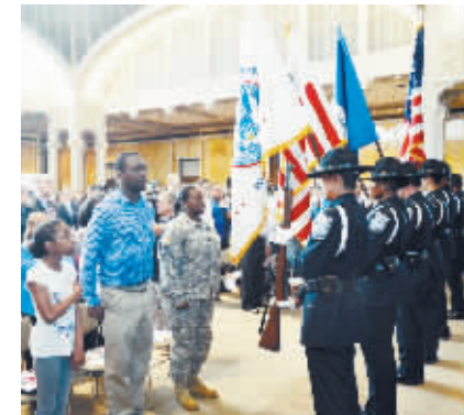
150 名美国新移民在纽约参加公民入籍仪式 7月2日，新移民在纽约曼哈顿参加公民入籍仪式。当日，美国公民身份和入境事务局在纽约为150名新移民举行公民宣誓与入籍仪式。今年美国独立日前夕，美国公民身份和入境事务局在全国为约7800名新移民举行了超过95场入籍仪式。

据新华社北京7月3日电（记者姜潇）产业报行业报新闻道德委员会7月3日在京成立。 据了解，作为新闻行业加强职业道德建设的自律机构，道德委成立后，将受理社会各界对产业报行业报及其从业人员职业道德失范行为的举报和投诉；对新闻从业人员违反职业道德行为进行监督，对违规违纪情况进行核查处理，对典型案例进行评议，治理解决产业报行业报突出问题；对新闻道德方面的倾向性问题进行调研，实施动态监测，提出风险预警；组织实施对新闻机