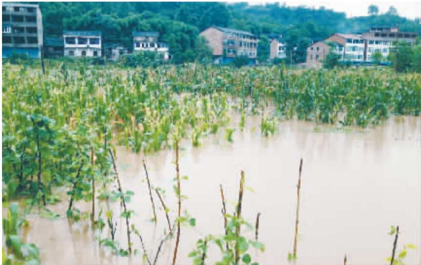
四川广安遭遇特大暴雨袭击 7 月 11 日，四川省广安市广安区枣山镇河西村因遭受特大暴雨袭击，部分庄稼被雨水淹没。

张宝晨说，构筑 21 世纪海上丝绸之路关键是解决合作国家的利益共享问题，建立可持续的区域合作关系，通过优势互补和互利互惠传导经济发展正能量，“既让自己过得好，也让别人过得好”应该成为沿路各国共同遵循的基本原则。