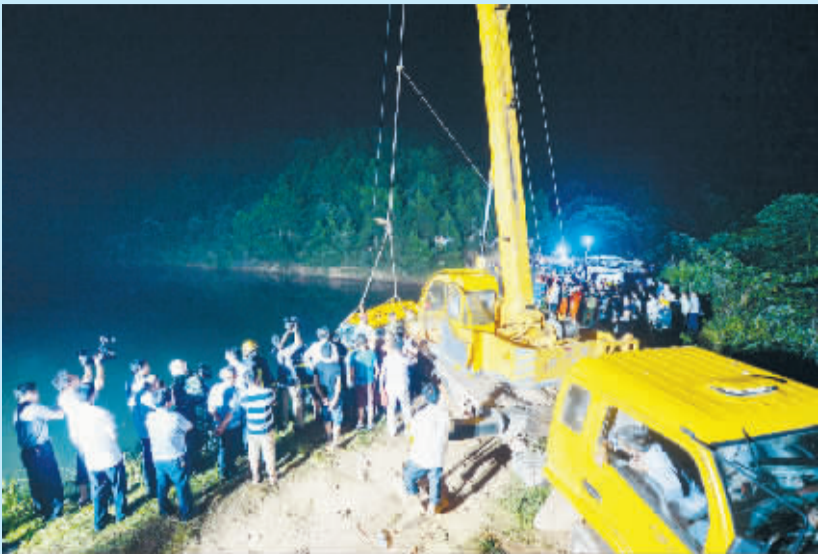
7 月 11 日，吊车将事故校车吊起。