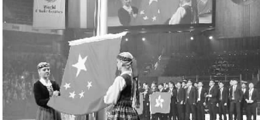
中国团队在第八届世界合唱比赛上首获两项冠军

据了解,按照“十二五”规划,明年两年尚有1.1亿农村居民和1535万农村学校师生饮水安全问题需要解决。这些农村居民和农村学校师生多数居住在自然条件差、农村饮水安全工程建设成本高的地区,建设难度较大。今年明年,我国将采取措施,攻坚解决这部分农村居民和学校师生的饮水安全问题。