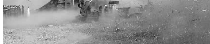
开炮瞬间 7月12日,在以色列南部与加沙的边境,一门以军155毫米M109系列自行榴弹炮向加沙地带开火。以色列对加沙地带发动的“护刃行动”当日进入第五天。巴勒斯坦方面称,以军的空袭仍在继续。这一天,巴武装人员继续向以色列境内发射火箭弹,约旦河西岸多地还发生了巴民众的抗议示威。

此外,河南省还将进一步改革职业教育财政投入机制,在全省所有职业院校实行按专业大类,在校规模 and 就业状况核定财政拨款的办法,逐步提高中等职业院校和高等职业院校生均经费标准,加大对职业教育的专项投入。