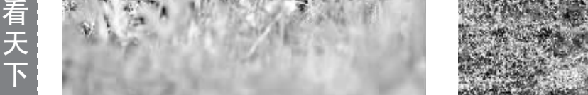
甜蜜的梦 7月6日,在奥地利萨尔茨堡一家农场,一只羊躺在开满野花的草地上睡着了。