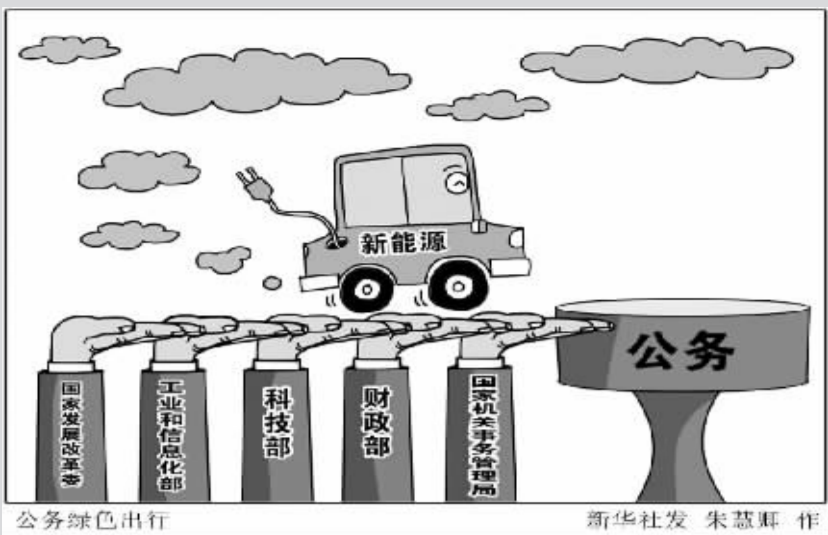
公务绿色出行 新华社发 朱慧琳 作

据新华社北京7月13日电(崔清新 高奇)国家机关事务管理局、财政部、科技部、工业和信息化部、国家发展改革委13日联合公布了《国家机关及公共机构购买新能源汽车实施方案》,明确了国家机关和公共机构公务用车“新能源化”的时间表和路线图。