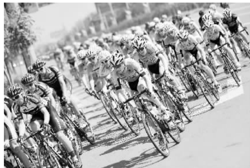
自行车——环青海湖国际公路赛进入第十二赛段

7月18日,参赛选手们在比赛中骑行。当日,第十三届环青海湖国际公路自行车赛进入第十二赛段——全程120公里的宁夏中卫赛段。日本维尼凡蒂尼队的格罗素以2小时35分09秒的成绩夺得赛段冠军。