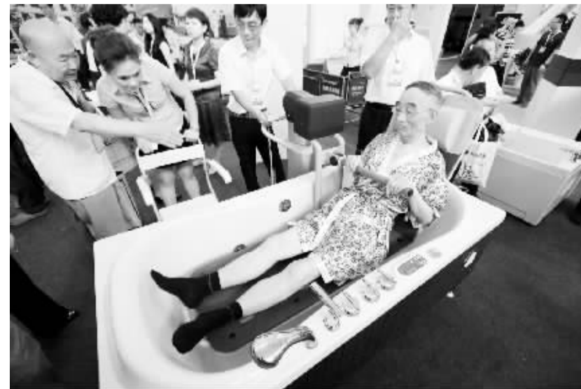
2014中国(辽宁)国际老龄产业博览会在沈阳开幕

7月18日,参观者在国际老龄产业博览会上参观老人和残疾人专用浴缸。当日,2014中国(辽宁)国际老龄产业博览会在沈阳辽宁工业展览馆开幕。来自海内外的220家参展商展出了老年医疗、护理、康复辅具等产品。