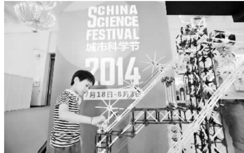
首届城市科学节暨暑期青少年科学节活动在京开幕

7月18日,在首届城市科学节上,一名小朋友在体验用积木搭建的“起重机”。当日,首届城市科学节暨暑期青少年科学节活动在北京展览馆开幕。本届城市科学节历时17天,主题为“创意无限,玩转科学”,共有来自中国、英国、美国、德国、新加坡、以色列、日本、韩国、奥地利的118个机构参展。