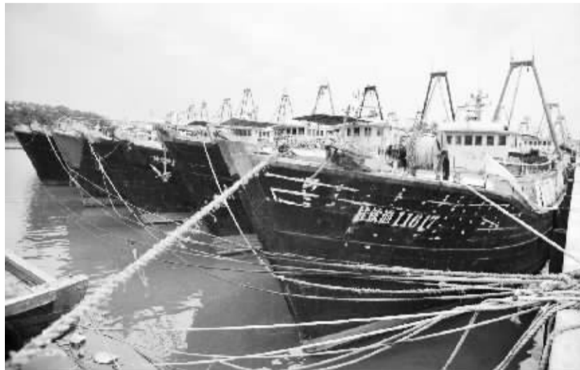
广西:千艘渔船北部湾紧急避风

公款吃喝进了谁的肚子?违规发放福利填了哪些人的腰包?家丑不能外扬的糊涂观念要不得,挠痒痒式的批评要不得。滥用公款,甚至盗抢,对滥用纳税人钱款这样的行为,就是要家丑外扬,并果断追究责任。只有这样,“三公账本”晒出的问题才不会“屡晒屡犯”。(新华社北京7月18日电)