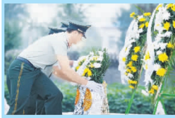
警民共祭甲午战争殉国将士

同时,全面推进事业单位、高风险企业(特别是建筑业农民工)、小微企业及有雇工个体工商户参加工伤保险;建立健全各项社会保险待遇确定和正常调整机制,确保各项待遇按时足额发放。