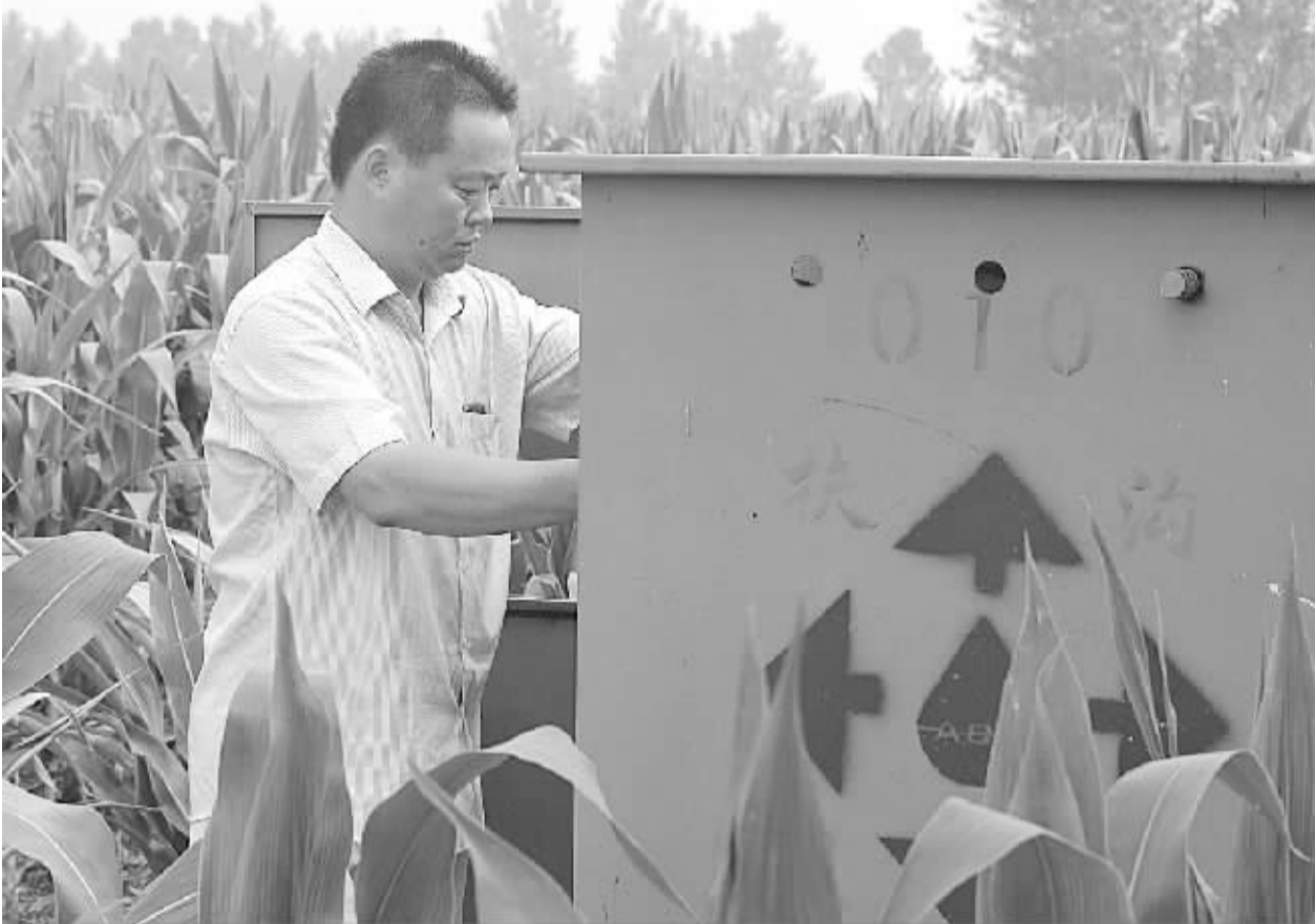
图 扶沟县大力推进农业综合开发工程，积极开展田间工程建设，农业设备日臻完善。图为工作人员在韭园镇中农合作社示范建设区检修设备。