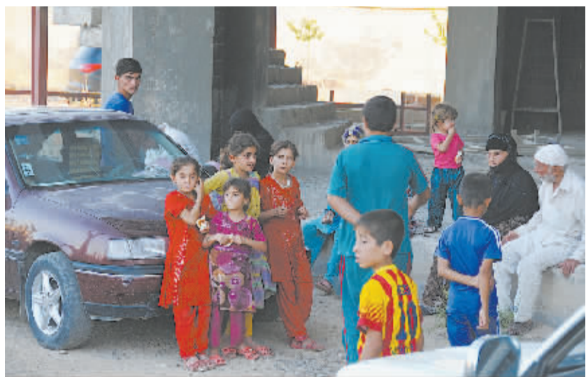
伊拉克北部武装冲突致40万人流离失所

东盟的发展壮大,坚定支持东盟在区域合作中的主导地位,坚定支持东盟2015年建成共同体。王毅就在落实“2+7合作框架”过程中推进中国-东盟关系进一步提出政治、地方、海上三大方面12项具体倡议,强调中方愿与东盟一道,继续坚持睦邻友好,加强团结互助,实现共同发展,为本地区乃至世界的和平、发展和繁荣作出更大贡献。