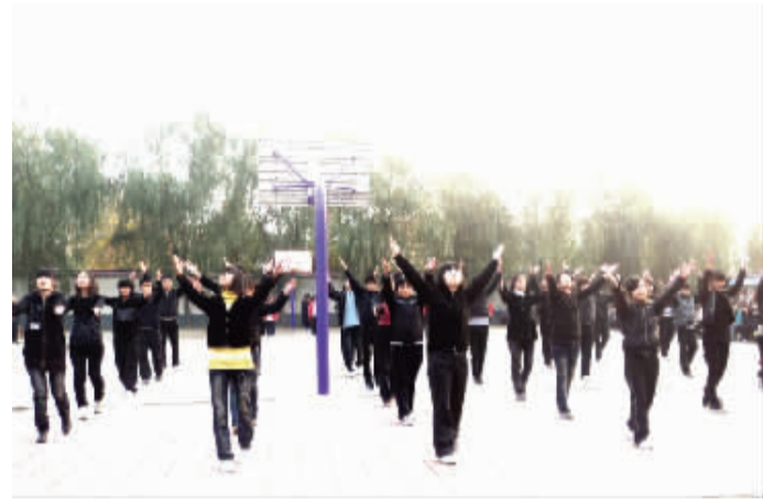
丰富多彩的课外活动