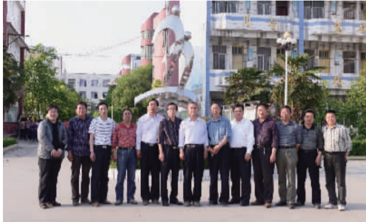
学校领导班子成员

艺术节上，师生们载歌载舞；运动会上，学生们青春飞扬；演讲比赛，每一位同学都激情澎湃；摄影大赛，每一幅作品都创意迭出……在西华一高，你可以嗅出诗词文赋的清香瑰丽，你可以听到器乐歌曲的宛转悠扬，你可以看见艺术画室的个性张扬，你可以感受文体活动的丰富多彩。让每一个学生在活动中培养自己展示自己，从而实现自我成长、自我发展、自我完善、自