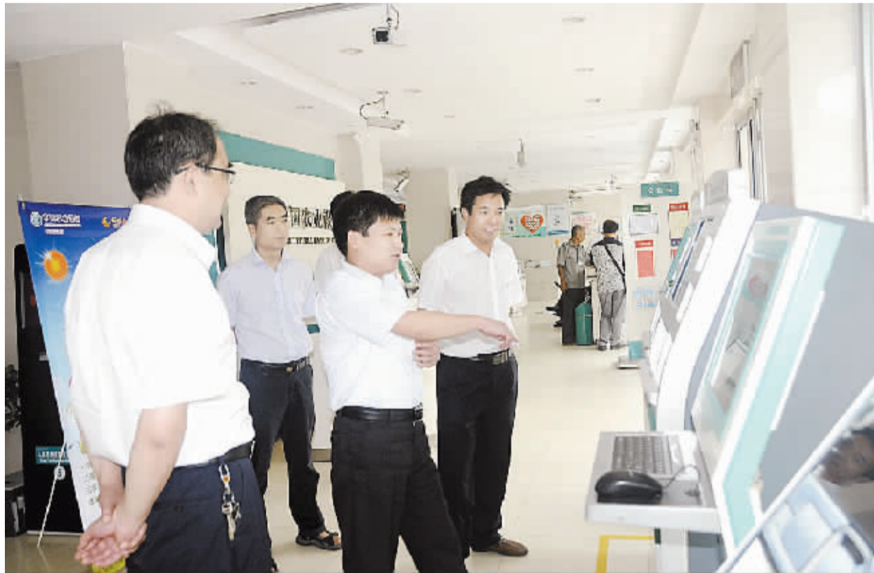
周口农行在全辖网点开展“整理、整顿、清扫、清洁、素养、安全”6S管理,实施标准化文明服务,努力让客户享受到便捷的现代化金融服务,并加大明查暗访力度,促进标准化文明服务能力的持续提升。图为该行行长突击检查营业网点服务设施。

活动期间,凡购买“福祿平安挂”1个,赠送1个红玛瑙搭配8颗银珠的鸿运连连银手串,市场价108元。详询周口农行个人金融部:8910833。