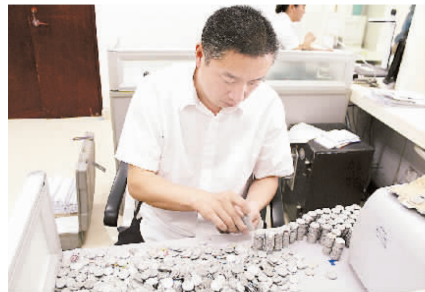
近日,鹿邑县农行营业部利用3天时间,集中人员力量,将一位客户运来的7大袋、重150公斤、约3万余元的硬币清点完毕并顺利入账,受到客户赞誉。图为清点现场。