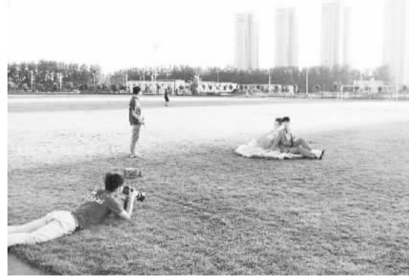
昨天,一对年轻人在东新区体育馆拍摄结婚照片。近几年,东新区建设日新月异,高楼林立,绿树成荫,移步皆景,成为不少影楼的外景拍摄地、市民休闲的好去处。

踊跃向志愿者询问相关反邪教知识,志愿者们耐心解答,并向他们发放反邪教宣传资料。集中活动结束后,志愿者们走访了祝寨各自然村群众,进行问卷调查和宣传资料的发放,还就反对邪教、崇尚科学的相关知识向附近群众进行讲解,得到了群众的积极参与和大力配合。本次活动参与群众800余人,分发各类反邪教宣传资料1000余份,取得了很好的宣传效果,营造了浓厚的反邪教氛围。(刘成海 张继新)