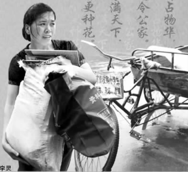
周口报业传媒集团 制 设计制作:三朝晖 张慧 杨珂