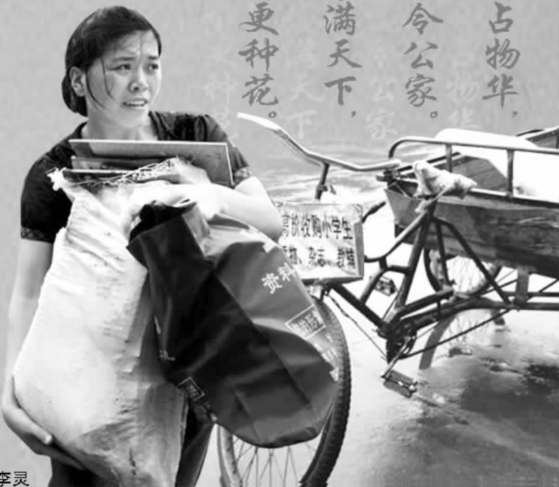
全国劳动模范、感动中国人物、李灵希望小学校长 李灵