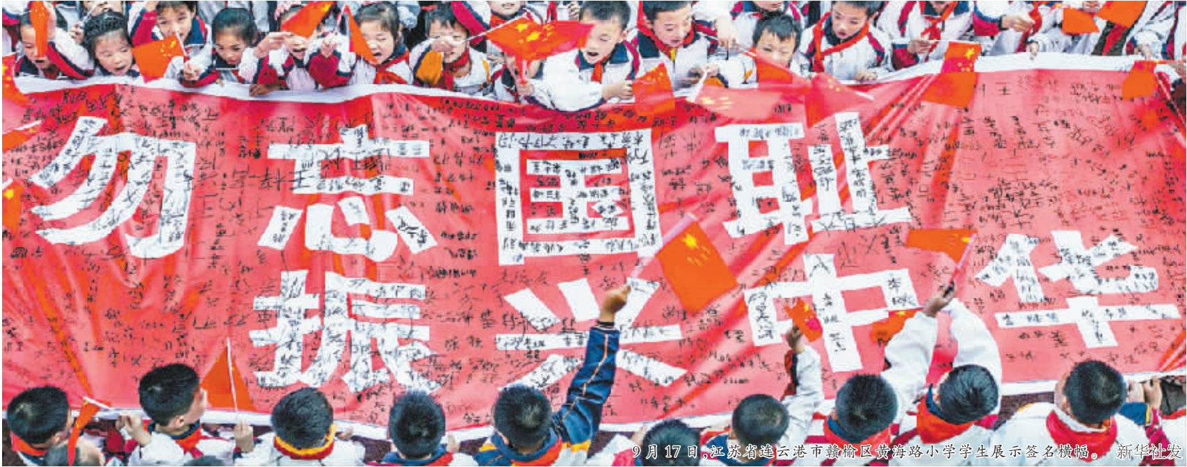
9月17日,江苏省连云港市赣榆区黄海路小学学生展示签名横幅。

“世界史之父”施吕策尔说,历史应当说明“地球和人类作为一个整体怎样从过去演进到现在”。从这个意义上讲,自人类由孤立走向连结,时间长河里的任何一截断片,在世界全景图上都有自己的映照。 1931 年的“九一八事变”便是这样一截历史断片,这场“一夜之间发生的战争”不但是 14 年日本侵华战争的肇端,更是第二次世界大战的真正起点。于中国,它刻下了山河 沦丧的耻辱;于日本,它种下了武力称霸的苦果;于人类,它留下了穷兵黩武的文明伤疤。 83 年后,当和平已成习惯,我们不禁要问:疯狂一战收场短短十余年,为何战争机器再次轰隆而动,将人类驱赶至自相残杀的混沌? 83 年后,当世界酝酿变革,我们不禁要问:国际秩序起承转合数百年,为何人类仍要用冲突搅动震荡,用战争改变格局,任贪欲、狂妄与野心肆意放纵?