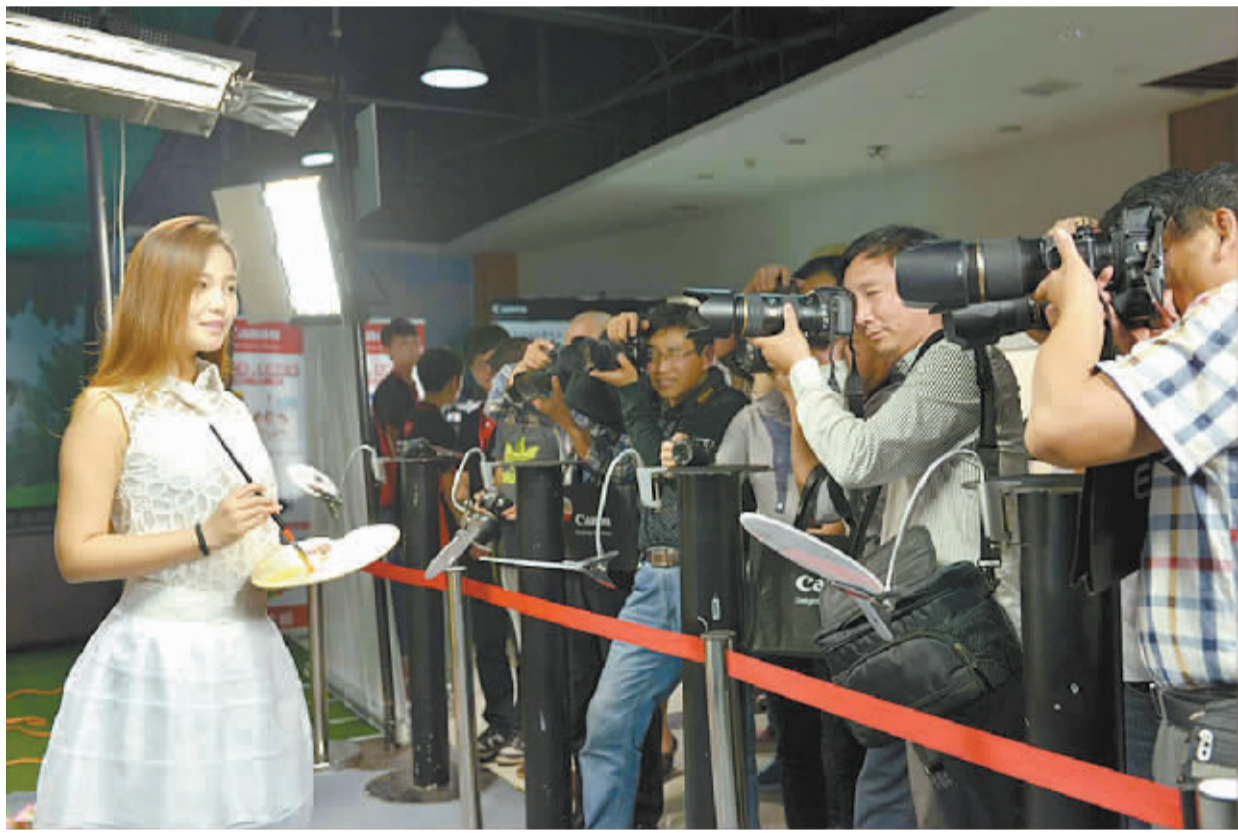
近日,周口市摄影家协会特邀佳能公司举办的“全国佳能EOS大篷车(周口站)公益摄影知识讲座”空降周口。活动邀请中国摄影家协会副主席、著名纪实摄影家雍和老师和举办了精彩的摄影知识讲座。我市180余位摄影爱好者参与了此次活动。

新的形势和任务对保密工作提出了新的更高要求。我们一定要以党的十八大精神和习近平总书记重要讲话精神为指导,深入贯彻《保密法》,筑牢保密防线,解放思想,求实创新,扎实工作,努力开创保密工作的新局面,为实现周口富民强市新跨越做出应有的贡献。