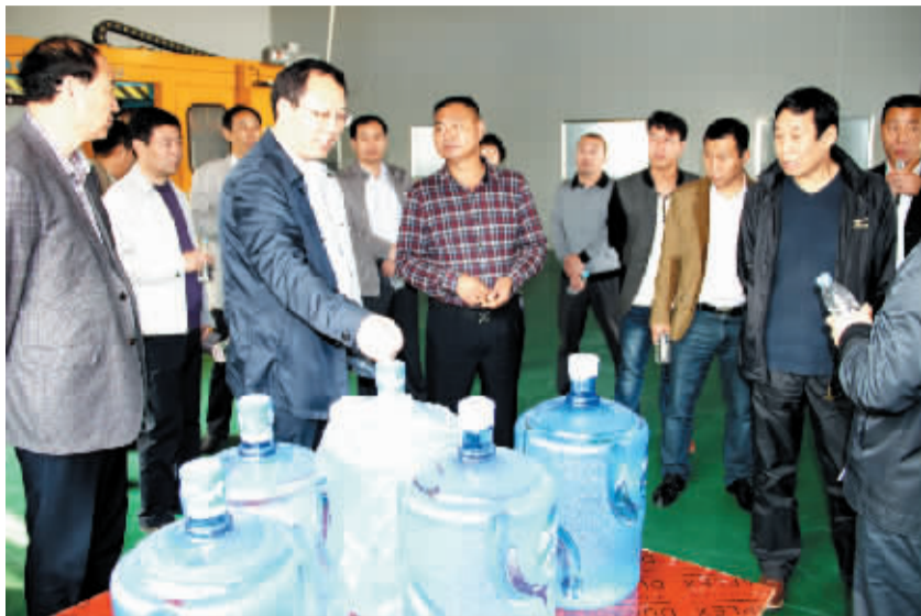
副市市长张广东调研我市食品工业发展情况