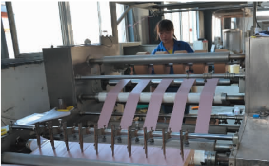
河南康迪药械有限公司医疗器械生产车间