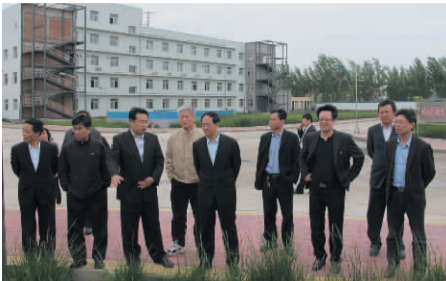
国家食药监总局稽查局局长毛振宾到我市调研医药工业发展情况