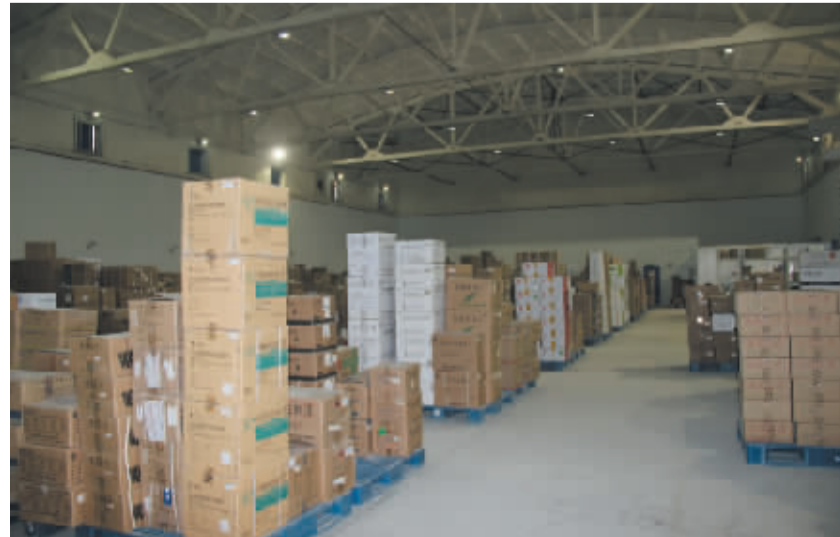
国药控股(周口)规范化药品仓储内景