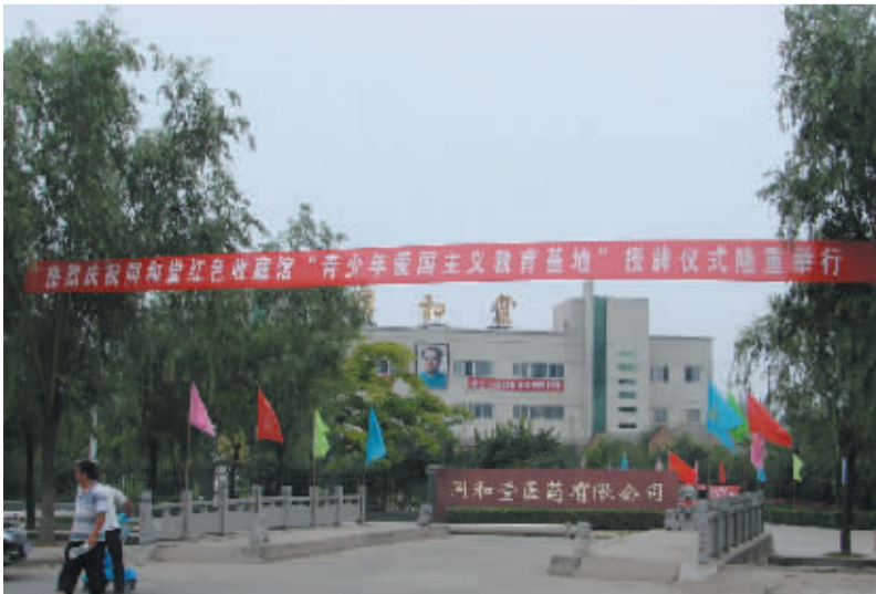
河南同和堂医药有限公司总部外景

我市工商、税务、药监等部门以自己的依法行政、规范行政赢得了监管相对人的尊重和好评。愿更多的单位加强管理，改变作风，抱着对人民、对历史负责的态度，带好队伍，为民服务，在有效作为中树立自己的良好形象。