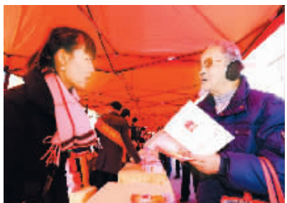
市民在西安宪法日宣传活动现场领取《中华人民共和国宪法》文本。