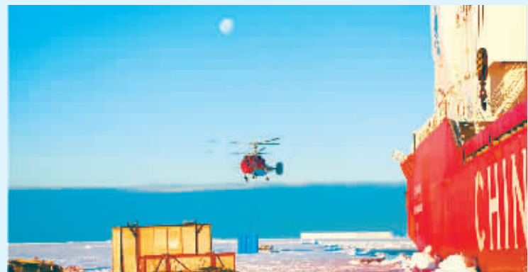
“雪龙”号在中山站外陆缘冰地带开展卸货作业。12月3日晚,直升机在“雪龙”号吊运货物向中山站运输。经过连续3天的艰难破冰,中国第31次南极科学考察队乘坐的“雪龙号”科考船日前穿越普里兹湾,抵达中山站外陆缘冰地带。

据国家统计局对全国31个省(区、市)农业生产经营户的抽样调查和农业生产经营单位的全面统计,2014年全国粮食播种面积为112738.3千公顷(169107.4万亩),比上年增加0.7%。粮食单位面积产量5385公斤/公顷(359公斤/亩),比上年提高0.2%。