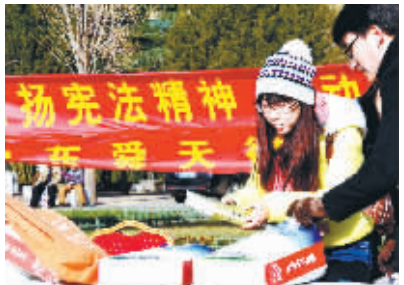
山东省某律师事务所的律师在活动现场准备宣传材料。