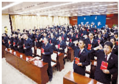
呼和浩特市赛罕区检察院85名干警手持宪法庄严宣誓。