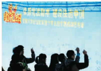
安徽大学学生在纪念国家宪法日主题活动中签名。