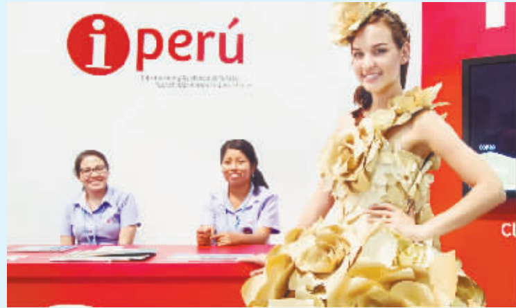
大会上的“小”环保。12月3日,在秘鲁利马,一名工作人员身穿用回收纸制作的服装迎宾。在秘鲁利马举行的联合国气候变化大会会场内外,从官方发布的文件到会议场馆布置,诸多细节体现出主办方用心将环保理念落于实处。