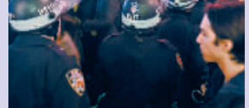
12月3日,抗议者在美国纽约曼哈顿举行游行示威。