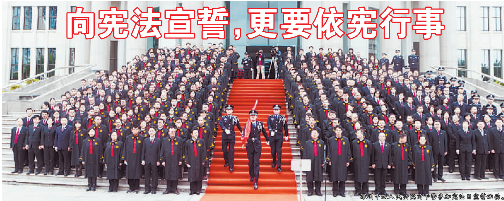
深圳中级人民法院的干警参加宪法宣誓活动。

12月4日是我国首个国家宪法日。国家宪法日的设立,意味着宪法在中国政治生活中的地位进一步凸显。